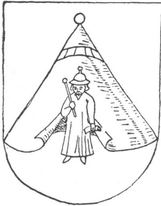
Fig. 29. Wappen von Klein-Hüningen, nach Ryff, Cirkell der Eidtgnoschaft

Hersberg und Nussdorf, zwei Weiler an der Grenze des Frickgaus, kamen im Jahre 1664 an Basel, und zwar dadurch, dass das Kloster Olsberg statt der Bezahlung einer der Universität geschuldeten Summe auf alle seine Rechte in den Bännen von Hersberg und Nussdorf verzichtete.