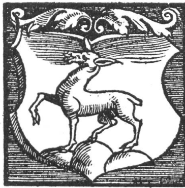
Fig. 24. Wappen der Grafen von Tierstein (nach Stumpf's Schweizer Chronik), fand Verwendung im Wappen des Amtes Farnsburg (Feld 2 und 3)