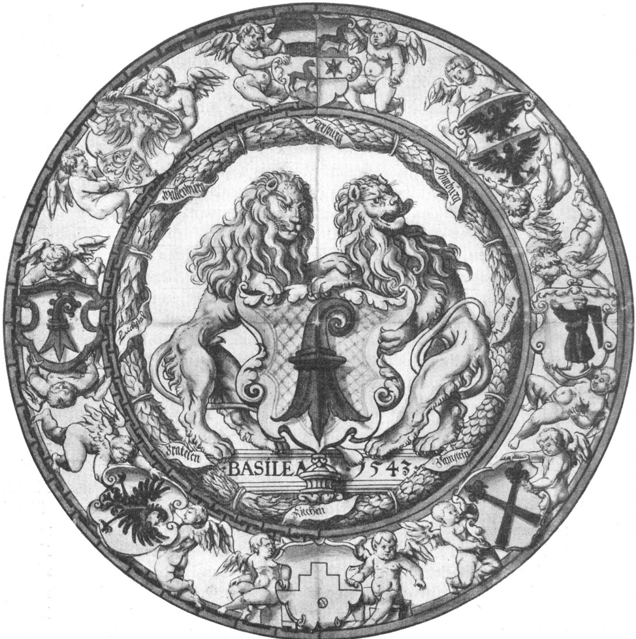
Fig. 19. Riss zu einer Basler Ämterscheibe von 1543 (Platte des Kupferstichkabinetts)

In der Zeit, da der Rat vom Bischof als dem Stadtherrn Stück für Stück der Herrschaftsrechte erwarb und dadurch mehr und mehr das Regiment in seine Hand bekam, treffen wir also erstmalig den Baselstab als Wappen der Stadt. In die gleiche Zeit fällt auch der erste grosse territoriale Gewinn der Stadt; er wird zum Anfang eines zusammenhängenden Herrschaftsgebietes.