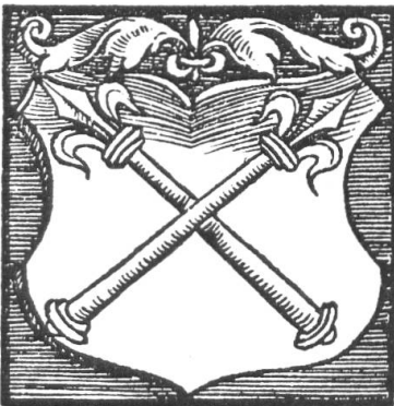
Fig. 26. Wappen der Herren von Ramstein und des Amtes Ramstein. Nach Stumpf's Schweizer Chronik

Im Jahr 1534 empfing Basel durch Tausch von Österreich die hohe Gerichtsbarkeit in den frickgauischen Dörfern Oltingen, Anwil, Rothenfluh und Giebenach.