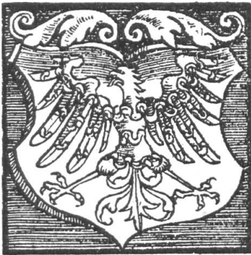
Fig. 20. Wappen der Grafen von Froburg, später als Wappen des Amtes Waldenburg verwendet. Nach Stumpf's Schweizer Chr.

Das Wappen des Amtes Waldenburg war das der Grafen von Froburg: in Gelb ein buntgefehter Adler mit roten Fängen 1) .