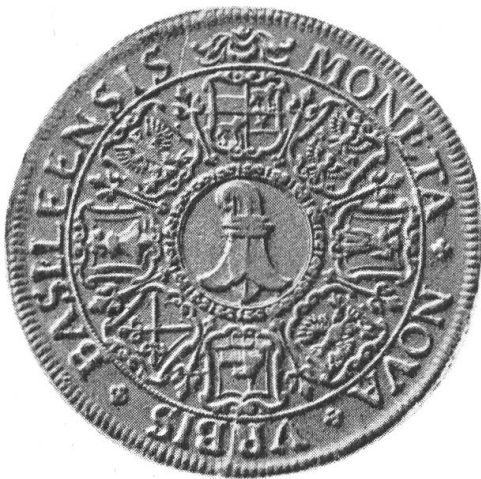
Fig. 30. Basler Doppeltaler vom Ende des XVII. Jahrhunderts mit Wappen der Basler Vogteien 1)

Birseck. 1815. Als Folge der grossen Ereignisse, die gegen Ende des 18. Jahrhunderts von Frankreich ausgehend auch die Einrichtungen der schweizerischen Eidgenossenschaft und damit Basels umgestürzt und Neues an deren Stelle gesetzt hatten, gab es in der Schweiz keine Untertanen mehr. Der Kanton Basel bestand in der Zeit, da die napoleonische Mediationsakte in Kraft war, aus drei Bezirken: Basel, Waldenburg und Liestal. Das vor den Toren der Stadt liegende Birseck war — wie das ganze Bistum Basel — französisch. Im Dezember 1813 zogen Truppen der Alliierten dort ein; sie wurden später durch schweizerische abgelöst. In Basel war am 4. März 1814 die Grundlage des Kantons durch eine neue Verfassung abgeändert worden. Stadt und Landschaft nebeneinander bildeten den Staat. In Wien tagte der europäische Friedenskongress. Im Verlauf der Verhandlungen wurde nun erwogen, die bischöflich-baslerischen Territorien schweizerisch werden zu lassen. Die Vertreter Basels setzten sich daraufhin für die Angliederung der Vogtei Birseck mit Aesch ein, und der Kongress beschloss schliesslich, dem Kanton Basel neun Dorfgemeinden zuzusprechen. Es wurde nun eine Vereinigungsurkunde zwischen