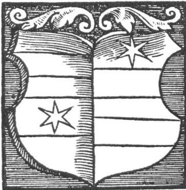
Fig. 23. Wappen von Farnsburg. Nach Stumpf's Schweizer Chronik. 1 und 4: von Falkenstein, 2 und 3: Zielemp 1)

Basel trat dem Bund der Eidgenossen bei. Wenn im Bundesbrief vom 9. Juni 1501 auch ausdrücklich der Stadt bei plötzlichem feindlichem Überfall ungebeten eidgenössische Hilfe zugesagt war, so war sie doch auch weiterhin darauf bedacht, das Gebiet der nächsten Umgebung zu erwerben. Nicht nur der Gesichtspunkt der Verteidigung der Stadt, sondern auch der Wunsch, Handel und Wandel zu fördern, hielten dieses Bestreben wach.