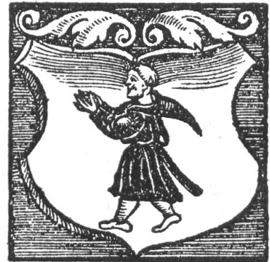
Fig. 25. Wappen der Mönch und des Amtes Münchenstein. Nach Stumpf's Schweizer Chronik

Eine Gebietserweiterung auf dem rechten Rheinufer brachte das Jahr 1513. Da wurde das Dorf Bettingen am Chrischonaberge von den Truchsessen von Wolhusen käuflich erworben. Nachdem die Stadt kurze Zeit, bis 1540, Bettingen für sich allein verwaltet hatte, unterstellte sie es der inzwischen geschaffenen Vogtei Riehen 2) . Aber bevor Riehen baslerisch wurde, gelang eine wertvolle Erwerbung auf dem linken Rheinufer.