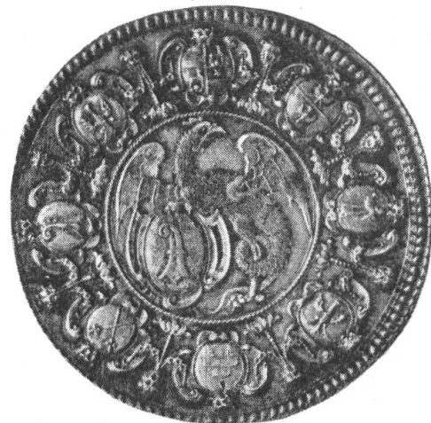
Fig. 31. Basler Doppeltaler aus dem XVIII. Jahrhundert mit Wappen der Basler Vogteien

Wie andere Städte hat Basel auf gewissen Münzen das Gebiet seiner Herrschaft mittels der Wappen seiner Vogteien verdeutlicht.