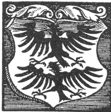
Fig. 21. Wappen der Grafen von Homberg, später des Amtes Homberg. Nach Stumpf's Schweizer Chronik