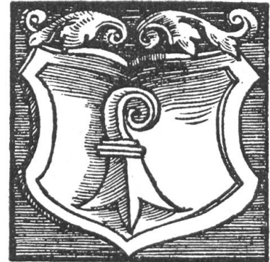
Fig. 22. Wappen des Amtes Liestal. Nach Stumpf's Schweizer Chronik. (Die Ballen fehlen hier). 1548

Homberg. 1400. Zur „Vestin Homberg“ gehörten bloss 7 Dörfer. Sie bildeten schon unter den Bischöfen ein Amt, „nüwe Homberg“. Graf Hermann IV. von Froburg, ein Enkel des Gründers von Waldenburg, war mit der Erbtöchter des letzten Grafen von Homberg, alte Linie, verheiratet; er hat mit ihr die Linie von Neu-Homberg begründet und von dem Schloss bei Läuelfingen seinen Namen hergenommen. Im 14. Jahrhundert ist sein Mannesstamm ausgestorben. Wie Waldenburg ist dann auch Homberg der unmittelbaren bischöflichen Gewalt unterstellt worden und ist darin geblieben, bis es zu Basel kam.