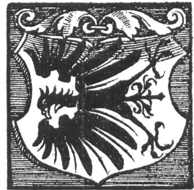
Fig. 28. Wappen der Herren von Eptingen und des „Amtes“ Pratteln. Nach Stumpf's Schweiz. Chronik. (Siehe S. 20)

Im selben Jahre wurde auch Augst an der Bruck (das heutige Augst) baslerisch.