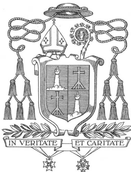
Fig. 55. Armoiries de Mgr Savoy, Prévôt du Chapitre de St-Nicolas.

professeur d'exégèse et de langue hébraïque au Séminaire de Fribourg, où il enseigna jusqu'en 1926. Dans l'Armée, il fut dès 1903 capitaine aumônier des régiments 6 puis 5 et enfin du 7 e régiment jusqu'en 1916. Il fut président de la Société des aumôniers de l'armée suisse de 1914 à 1916. Pendant la Grande guerre, il remplit les fonctions d'aumônier en chef des officiers et soldats internés de 1914 à 1919. En récompense des grands services qu'il avait ainsi rendus, le Pape le nomma Prélat de sa maison et la France lui offrit la croix de la Légion d'honneur. En 1924, il fut nommé recteur du Collège St-Michel à Fribourg, qu'il dirigea avec distinction jusqu'en 1939. Le 21 octobre 1938, il fut nommé chanoine résident du Chapitre de la Cathédrale de St-Nicolas. Puis le Grand Conseil l'appela à la haute charge de Prévôt de ce Chapitre. Cette nomination fut