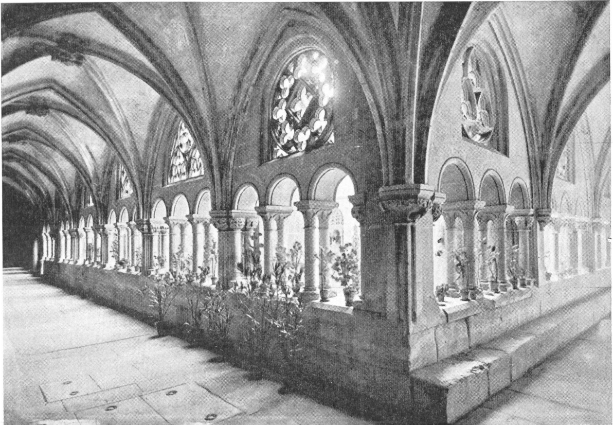
Fig. 117. Le cloître de l'abbaye cistercienne d'Hauterive près Fribourg.

Notre dernière Assemblée générale qui mêla le tragique à la douceur laissera un impérissable souvenir à tous ses participants. L'assemblée était nombreuse en dépit des circonstances, le programme heureusement choisi et le temps idéal, chacun s'abandonnait au charme d'une rencontre si parfaitement réalisée quand, comme dans une Danse des Morts, l'Inévitable vint désigner de son doigt sec un de nos compagnons . . .