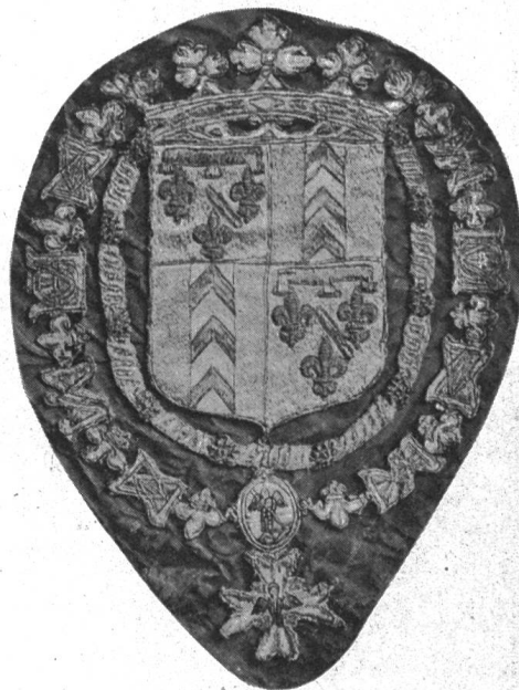
Fig. 46. Broderie d'Henri II d'Orléans-Longueville.

D'autre part l'abbé d'Orléans pour lequel fut gravé l'ex-libris fort connu 2 ) n'est pas comme on l'a cru généralement Jean-Louis-Charles, prince de Neuchâtel, « minus habens » notoire, mais Gabriel d'Orléans-Rothelin († 1714), abbé de Notre-Dame de Josaphat et doyen de Gournay, fils d'Henri ci-dessus. Celui-ci possédait une importante bibliothèque, vendue en 1745, dont le catalogue porte sur son titre l'ex-libris en question (fig. 47). Le doute n'est donc plus permis, d'autant plus que ... « M. l'abbé de Rothelin possédait, outre la science de son état, toute la littérature et toutes les connaissances propres à un homme de lettres qui était la gloire et l'étonnement de deux célèbres académies. L'usage qu'il faisait de ces talents et de tant de qualités essentielles qui le rendaient également aimable et respectable, sont bien dignes des Eloges que d'illustres Académiciens ont consacrés à sa mémoire... » 3 ).