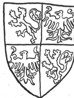
Fig. 43. Le comte de Longueville (Arm. Chandon de Briailles, vers 1450).

Quant au troisième quartier, ce doit être une mauvaise représentation des armes de Parthenay (burelé d'argent et d'azur de dix pièces à la bande de gueules brochant sur le tout). Dunois possédait cette terre de sa deuxième femme qui en était l'héritière de la façon suivante :