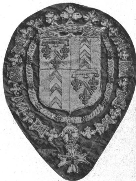
Fig. 46. Broderie d'Henri II d'Orléans-Longueville.