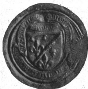
Fig. 44. Contre-sceau de Jean, comte de Dunois (S.IEHAN CONTE DE DUNOIS (et de Longu) EVILLE SEIGNEUR DE PARTENAY).

Marie d'Harcourt, dame de Parthenay etc. † 1464 ép. 1439 Jean, bâtard d'Orléans, comte de Dunois et de Longueville † 1468.