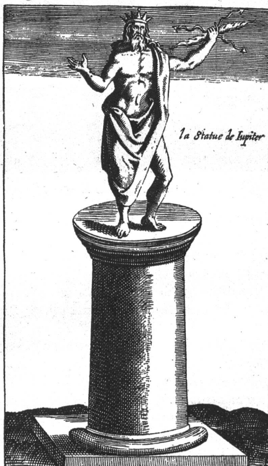
Fig. 8. La statue de Jupiter dans la « Vie de St-Bernard » de Viot. 1627.

La prévôté des Sts Nicolas et Bernard de Mont-Joux fait partie de l'ordre canonial dont St-Thomas dit qu'il a pour objet la vie contemplative dans la célébration des offices divins (Somme Ila Ilae 189, viii ad zum). Cet ordre adopta la règle de St Augustin, prescrite par le 2 e concile de Latran en 1139. De là vient qu'on appelle parfois les chanoines réguliers chanoines de St Augustin. A ces caractéristiques de tout l'ordre canonial, la prévôté du Grand-St Bernard ajoute un but particulier: aider les voyageurs à franchir le col du Mont-Joux. Conformément à ce but, ils eurent dès l'origine des constitutions propres. Il ne reste que