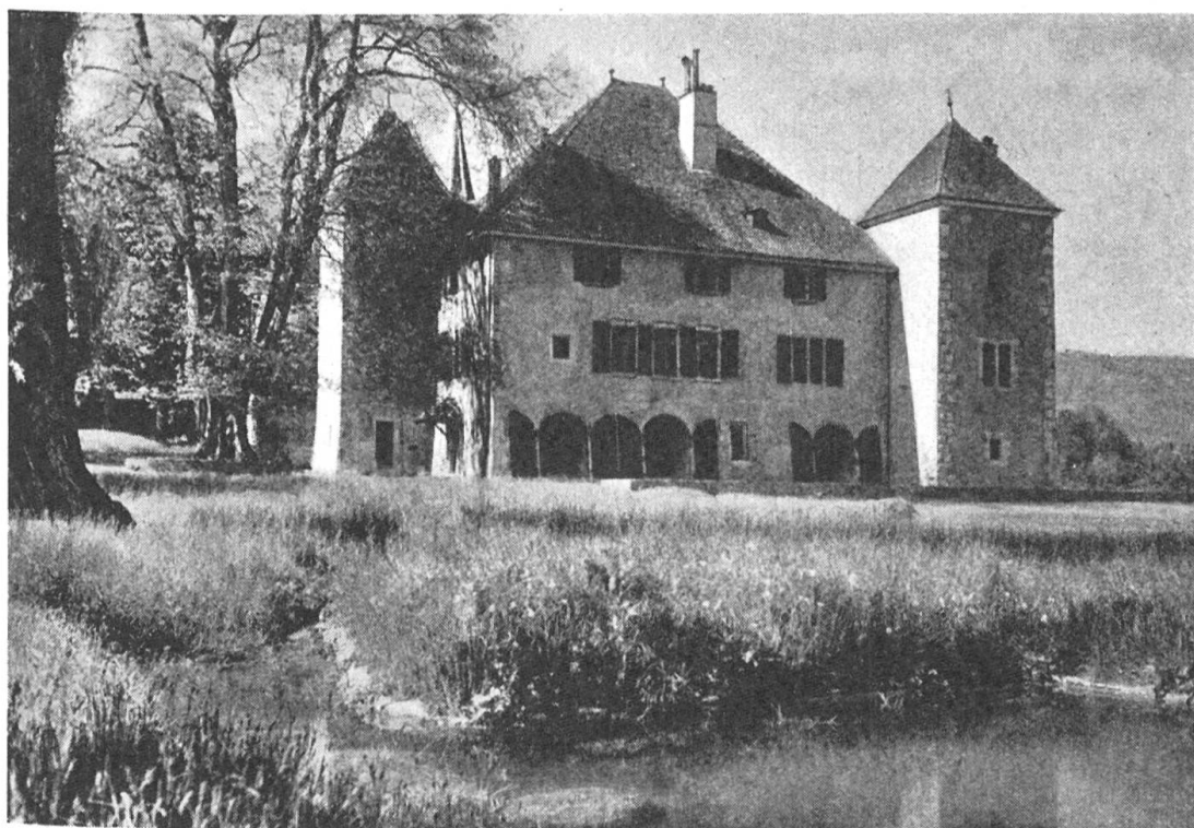
Fig. 127. Château de Gingins, construit vers 1441, par Jean de Gingins.