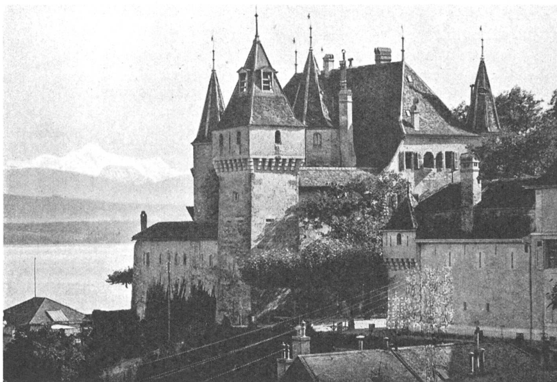
Fig. 126. Château de Nyon, résidence des baillis bernois, reconstruit de 1572 à 1577.