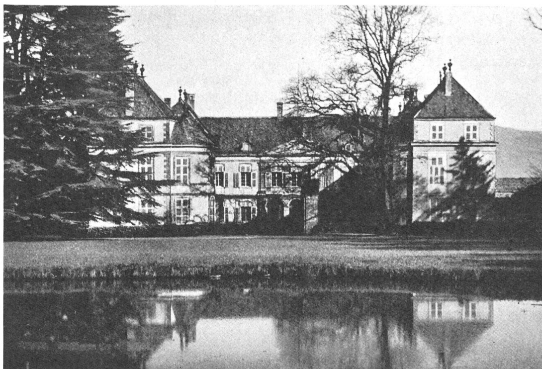
Fig. 129. Château de Coppet, reconstruit par Gaspard Smeth, 1767—1771.