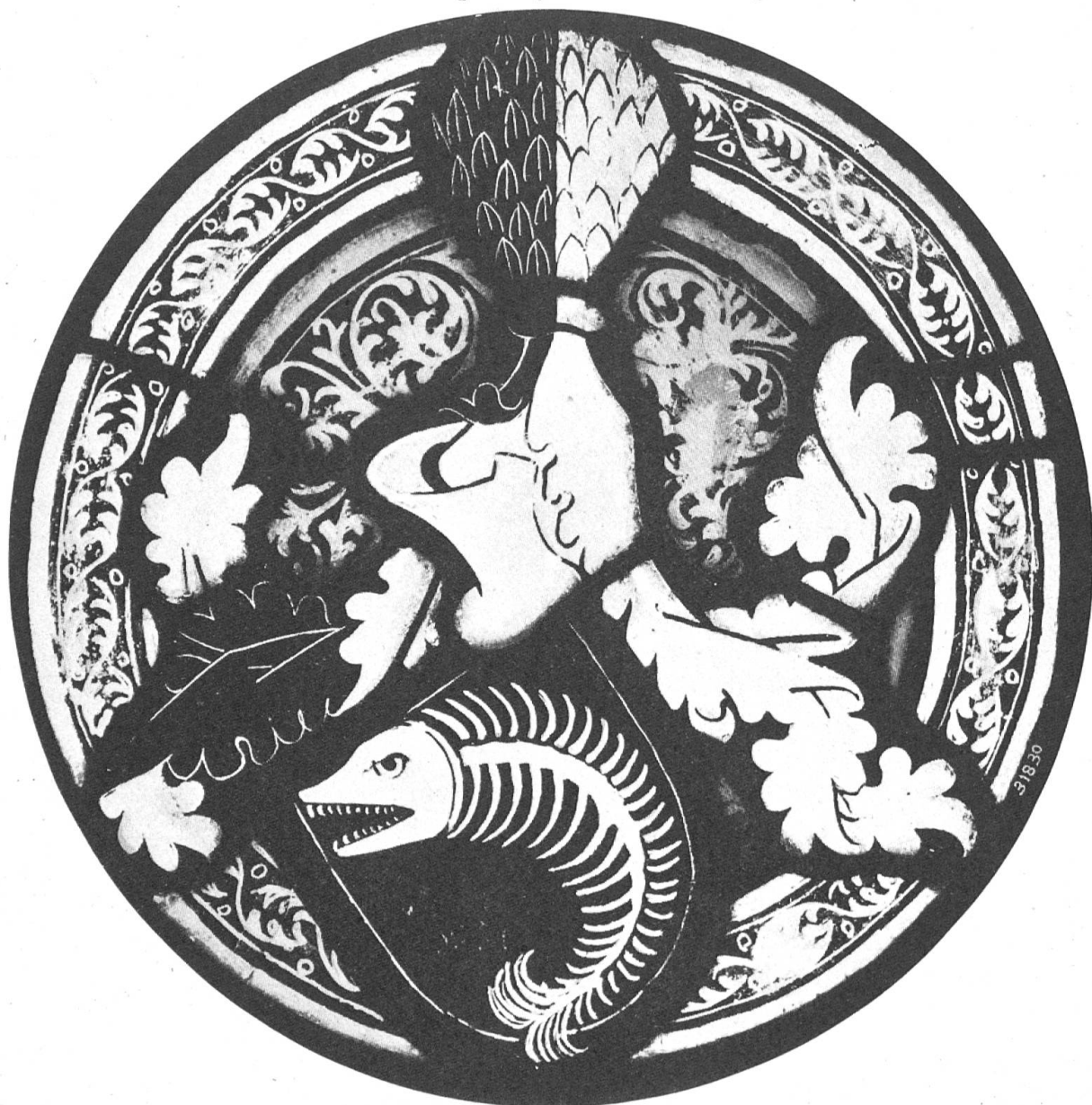
Fig. 107. Vitrail aux armoiries de Praroman.

Le Musée national à Zurich a fait l'acquisition en 1936 d'un petit vitrail rond aux armes de Praroman famille qui a joué un rôle important dans l'histoire de