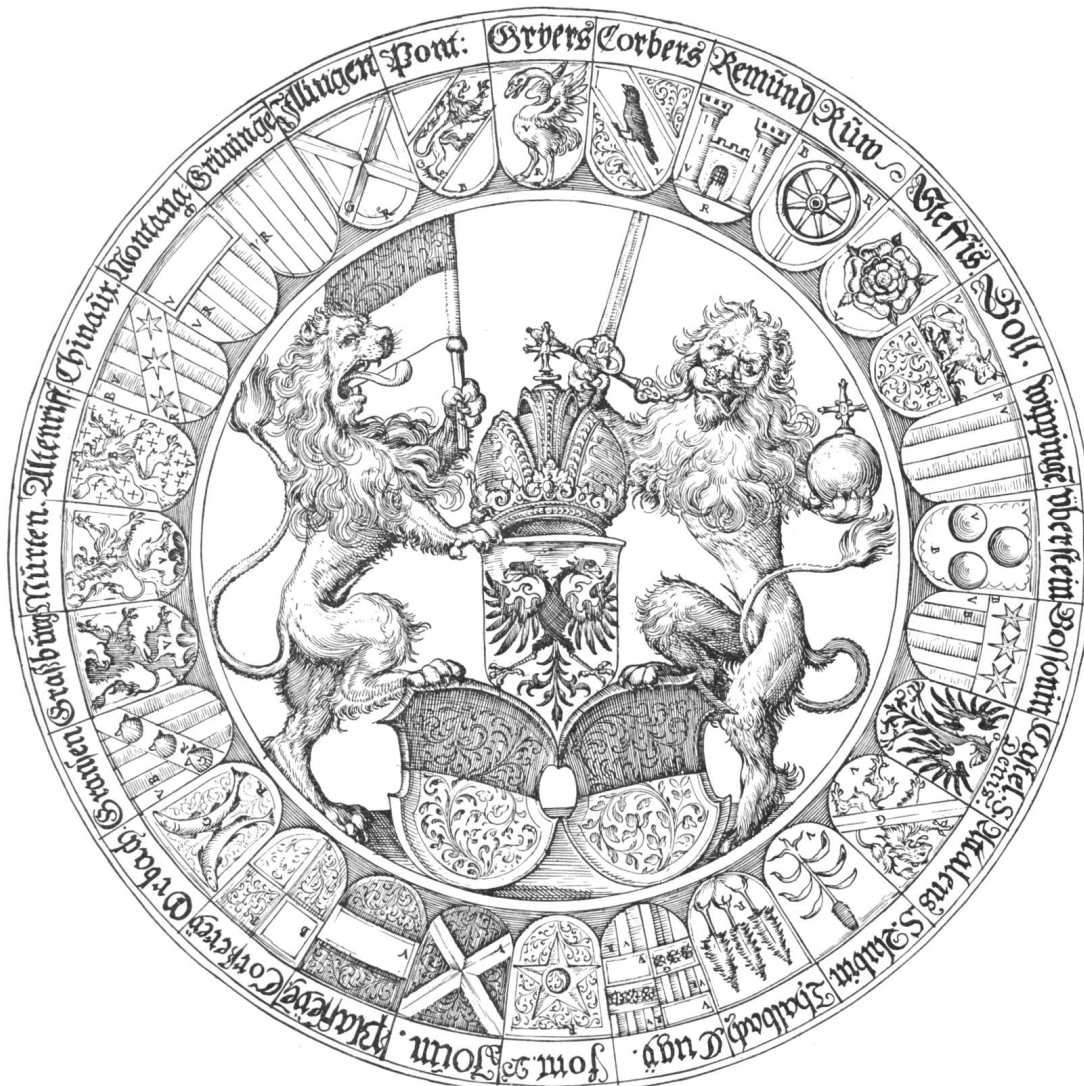
Fig. 120. Armoiries de la Ville et République de Fribourg et de ses bailliages, composition figurant sur le plan de Fribourg gravé par Martin Martini en 1606.

Estavayer et les localités qui en dépendaient furent alors érigés en un bailliage auquel on attribua les anciennes armes de la ville, soit: d'argent à la rose de gueules boutonnée d'or et feuillée de sinople . Tandis que les armes de la ville d'Estavayer