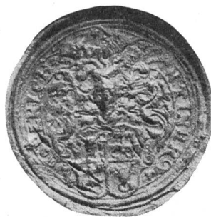
Fig. 90. 1578.