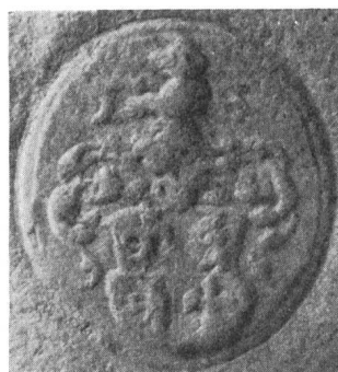
Fig. 87. 24. XI. 1567.

Albrecht gehörte frühzeitig dem Landrate an und seit 1554 dem Kriegsrat; 1544 bis 1547 amtierte er als Landvogt in Lifenen, und war von 1561 bis 1573 Tagsatzungsbote.