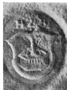
Fig. 94. 1572—1576.

vorragendste dieses vornehmen Geschlechtes, ein intimer Freund des hl. Kardinal Karl Borromäus und mit Ritter Melchior Lussi ein Hauptförderer der katholischen Interessen in der Urschweiz. Die katholischen Orte sandten ihn nach Rom als ihren Vertreter zum Abschluss der tridentinischen Verhandlungen 1562 und 1563.