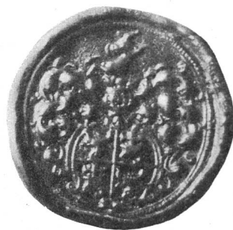
Fig. 91. 1580.

gesandter; während 10 Jahren, von 1567 bis 1577 hielt er das Landesstatthalteramt inne.