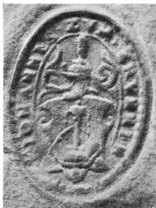
Fig. 93. 23. XI. 1572.