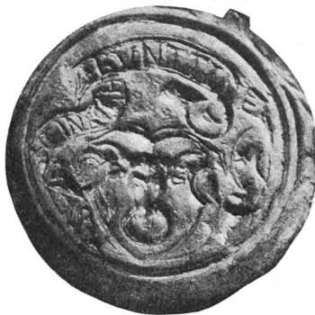
Fig. 89. 46. Heinrich Püntener. 18. I. 1573.

Vorerst war Püntener 1556 und 1557 Landvogt zu Locarno. Als solcher bewirkte er eine bessere Einheit im Strafrechte und eine Reduktion der Löhne und Gebühren für die Landvögte von Locarno, Lugano und Mendrisio, welche Entlastung der Untertanen noch 1556 durch die Tagsatzung verfügt wurde. In den Jahren 1561 bis 1580 vertrat Heinrich Püntener seinen Kanton als Tagsatzungs-