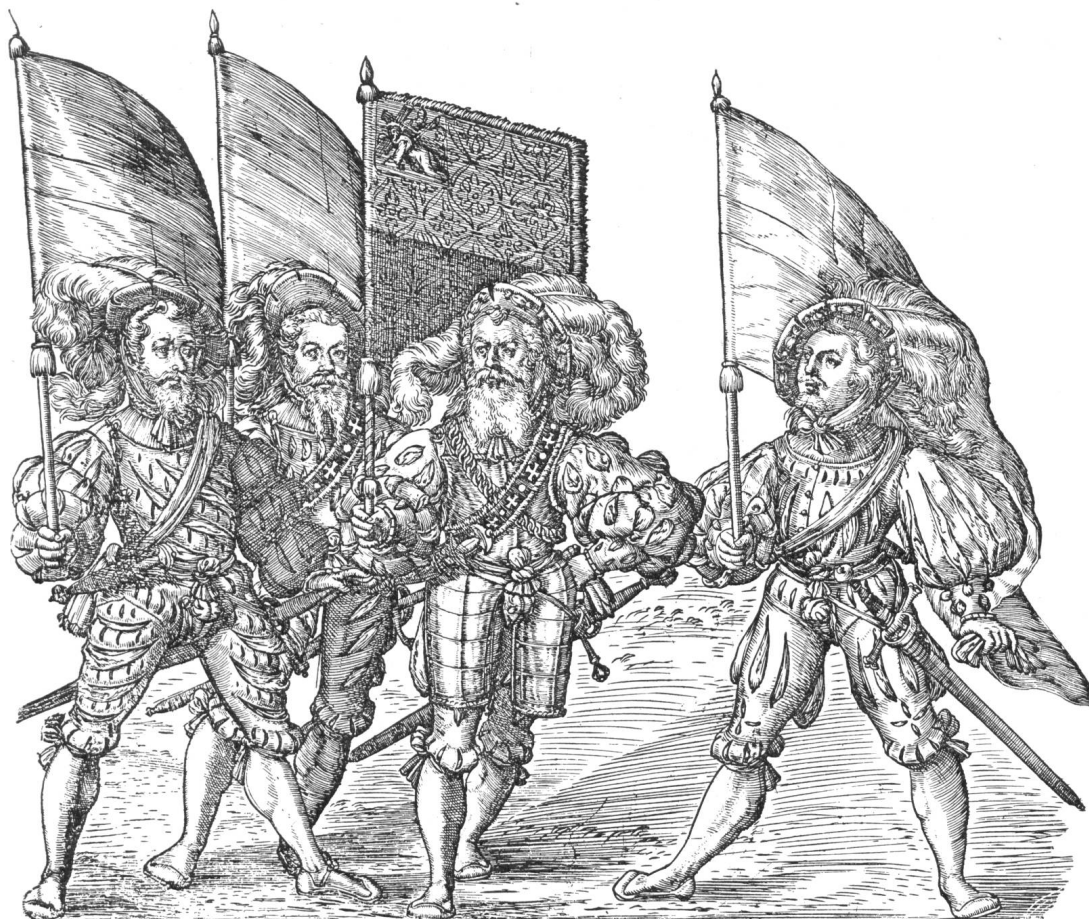
Fig. 6. Les quatre bannerets de Fribourg sur le plan de cette ville gravé par Martin Martini en 1604.

qui entourait la ville était formé de fiefs appartenant aux comtes de Tierstein et tenus pour la plupart par des vassaux qui pour avoir l'appui de Fribourg s'étaient fait recevoir bourgeois de cette ville. En 1442 Fribourg acheta tous ces fiefs du comte Jean de Tierstein et la vente en fut ratifiée par l'empereur Frédéric III en qualité de suzerain 1 ).