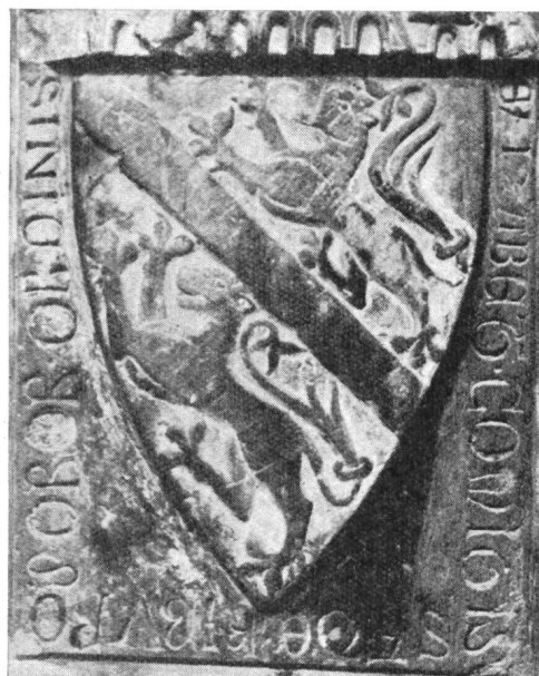
Fig. 2. Armoiries d'E. de Kibourg, 1275.

Fribourg conserve encore un monument aux armes des Kibourg soit la pierre tombale d'Elisabeth de Kibourg, seconde femme de Hartmann le Jeune, morte en 1275 (fig. 2).