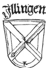
Fig. 10. Armoiries d'Illens.

Illens. Les Fribourgeois en voulaient à Guillaume de la Baume, seigneur d'Illens et d'Arconciel parce qu'il avait embrassé la cause du duc de Bourgogne. Aidées par celles de Berne les troupes de Fribourg prirent, le 4 janvier 1475, le château d'Illens d'assaut. Au congrès de Fribourg, en 1484, la possession de cette seigneurie fut reconnue à Fribourg seule qui en fit un petit bailliage auquel on attribua les armes de la famille des ministériaux d'Illens, soit: de gueules au sautoir d'or (fig. 10). Elles figurent déjà sur l'écu de Fribourg de 1531 ainsi que sur un vitrail rond du Musée de Fribourg, que nous reproduirons plus loin, datant de 1530 environ. Le bailli d'Illens résidait à Fribourg.