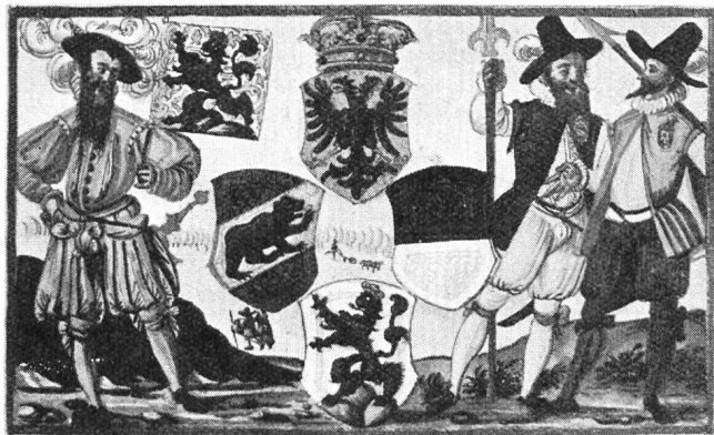
Fig. 3. Armoiries du bailliage de Grasbourg dans la Chronique de Ryff.

Grasbourg. Les bonnes relations qui existaient au commencement du XV e siècle entre Berne, Fribourg et la Savoie, déterminèrent le duc Amédée VIII à vendre