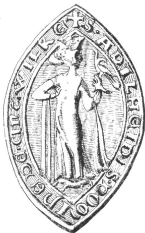
15 Siegel der Gemahlin von Nr. 12 Adelheid, Frau v. Zinsweiler 1271 u. 1278