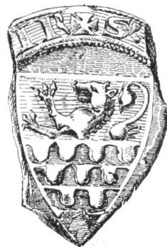
12 3. Siegel von Nr. 9 Otto. 1303