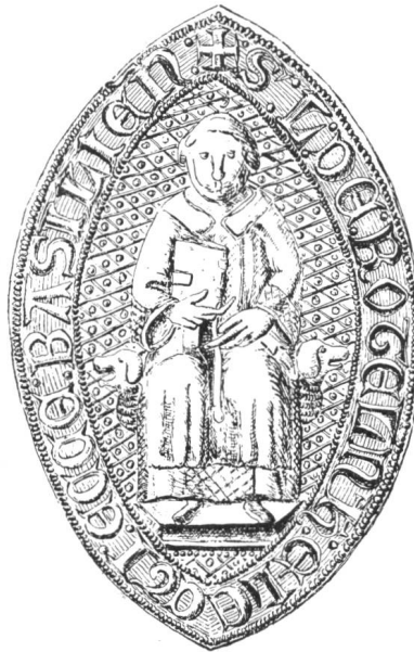
10 5. Siegel von Nr. 8 Liutold II. als Erwählter v. Basel 1309—1310