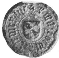
Fig. 53. Walter Zumbrunnen 14. VI. 1436.