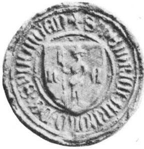
Fig. 52. Heinrich Arnold von Spiringen 11. V. 1451

Jost Käs vertrat Uri auch als Tagsatzungsgesandter und Ratsbote von 1440 bis 1447, beim Friedenstraktat mit Mailand, 4. April 1441. Erster ernerischer Landvogt zu Baden 1445—1447, verteidigte er ruhmreich und mit Erfolg die Stadt Baden gegen die Angriffe der Zürcher im Jahr 1445.