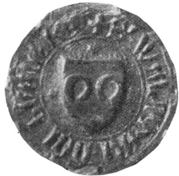
Fig. 47. Walter Büeler 2. III. 1413.

11. Johannes Rot folgte Walter Büeler im Landammannamte, das er 1404 bis 1422 innehatte, bis zu seinem Tode am 20. Juni als Landshauptmann und Anführer der Urner in der Schlacht bei Arbedo. Er wohnte in Altdorf und entstammte einem Geschlecht, das 1280 erstmals in Seelisberg und später in Schattdorf, Bürglen,