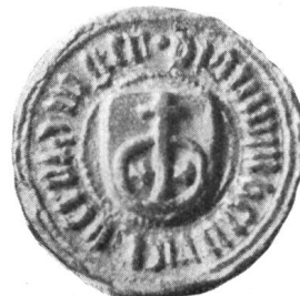
Fig. 50. Heinrich Beroldinger 9. III. 1437.

14. Heinrich Arnold von Spiringen , Landammann 1432—33, 1438—39, 1443—44, 1446—47, 1449—50 und 1459—61.