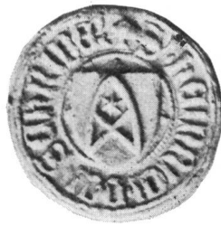
Fig. 49. Heinrich Schreiber 22. VII. 1432.