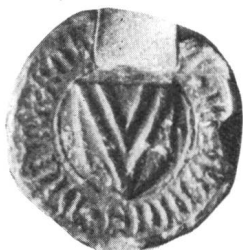
Fig. 48. Johannes Rot 15. VI. 1411.

Belege: Urkunde No. 398 und 400 des Staatsarchives Schwyz, vom 9. März und 23. April 1437 (Schiedsspruch der 19 eidg. Boten zwischen Zürich und dem Grafen von Toggenburg einerseits und den Ländern Schwyz und Glarus anderseits), Urfehde des Marti Truk, vom 5. Januar 1426 (Staatsarchiv Luzern), Gerichtsspruch wegen einem Haus in Spiringen, vom 5. Juni 1427 (Staatsarchiv Uri, No. 104), Gerichtsurteil vom 28. Juni 1428 betreffend Alprecht in Ursern des Anton Spilmatter von Wassen (Talarchiv Ursern).