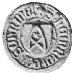
Fig. 49. Heinrich Schreiber 22. VII. 1432.