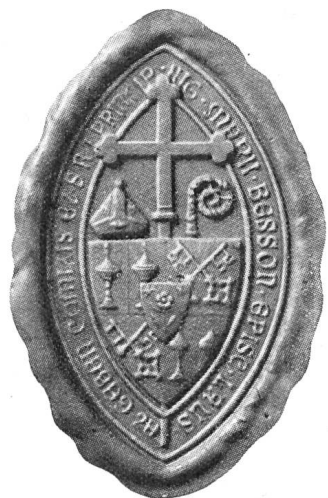
Fig. 75. Sceau de Mgr. Besson en usage jusqu'en 1924.

Le Chapitre de St-Nicolas continuait cependant à subsister dans le nouveau Chapitre et ses nouvelles constitutions renferment ainsi que le prévoit le canon 410 § 1 du code de droit canonique, l'énoncé des lois particulières qui régissent ce collège pour autant qu'elles n'ont pas été fixées par la Bulle Sollicitudo omnium