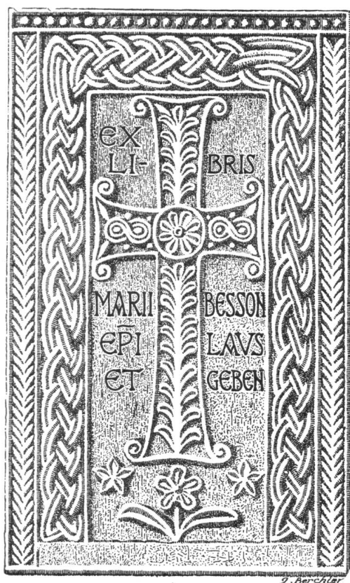
Fig. 72. Ex-libris de Mgr. Besson.

Gudinus. C'est le dessin de cet ambon qui a été choisi comme motif de cet ex libris. L'inscription EX LIBRIS MARI EPI LAUS. ET GEBEN. a été composée avec les mêmes caractères que ceux de l'inscription originale. L'ambon a été copié fidèlement à part un petit changement introduit dans le bas de ce monument, où les deux petites plantes qui sont au bas de la croix ont été remplacées par une fleur ornée de deux feuilles et accompagnée de deux petites étoiles. Ces figures qui sont tout à fait dans le style de l'ambon rappellent en même temps les armes de Mgr. Besson. Cet ex libris a été dessiné par M. Jean Berchier, professeur au Technicum de Fribourg.