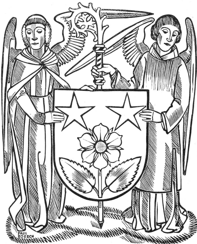
Fig. 71. Armoiries de Mgr. Besson d'après une gravure sur bois de M. Paul Boesch (réduction).

Ces armoiries se lisent : d'argent à la fleur de gueules tigée et feuillée de deux pièces de sinople et accompagnée en chef de deux étoiles du second (fig. 71).