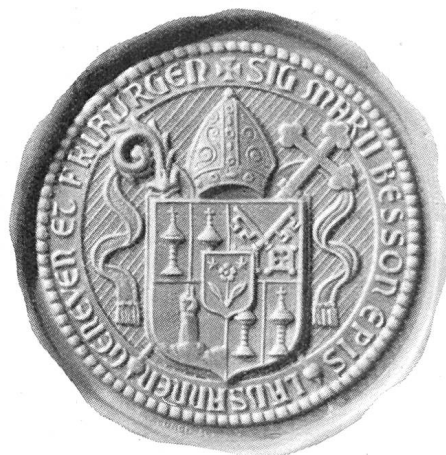
Fig. 76. Sceau de Mgr. Besson dès 1924.

ecclesiarum , ou par les Constitutions synodales du diocèse. Là où le code de droit canonique, ni les nouvelles constitutions ne les contredisent, les constitutions antérieures du Chapitre de St-Nicolas restent en vigueur.