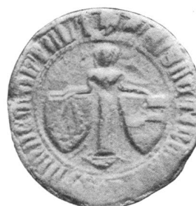
Nr. 3 Siegel von Nr. 9 des Textes (Elisabeth)