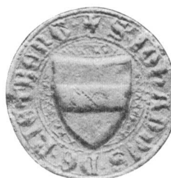
Nr. 2 Siegel von Nr. 4 des Textes (Joh.)