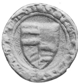
Nr. 2 Siegel von Nr. 7 des Textes (Simon)