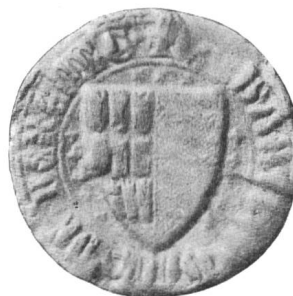
Nr. 2 Siegel von Nr. 5 des Textes (Bartholomäus)