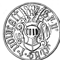
Fig. 123. C 12 — Rodolphe de Hochberg (à suivre) (1475/76).

L'un des deux contre-sceaux du très beau sceau équestre de Philippe de Hochberg nous montre un casque de trois quarts couronné, cimé des deux cornes de bouquetin et environné de lambrequins. Sur l'autre le casque, de face, est orné des mêmes accessoires comme sur l'un des petits sceaux de son père (C 19 — 1487; C 20 — 1488/95; pl. XXII; C 12 — 1475 — fig. 123).