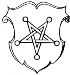
Fig. 29. Gurnel.