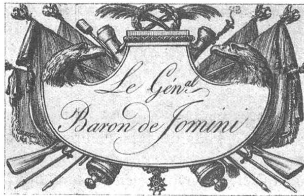
Fig. 141. Ex libris du Général Jomini.

neur de Vilna et de Smolensk. Il contribua à la victoire de Bautzen, mais Berthier empêcha qu'il fût nommé général de division.