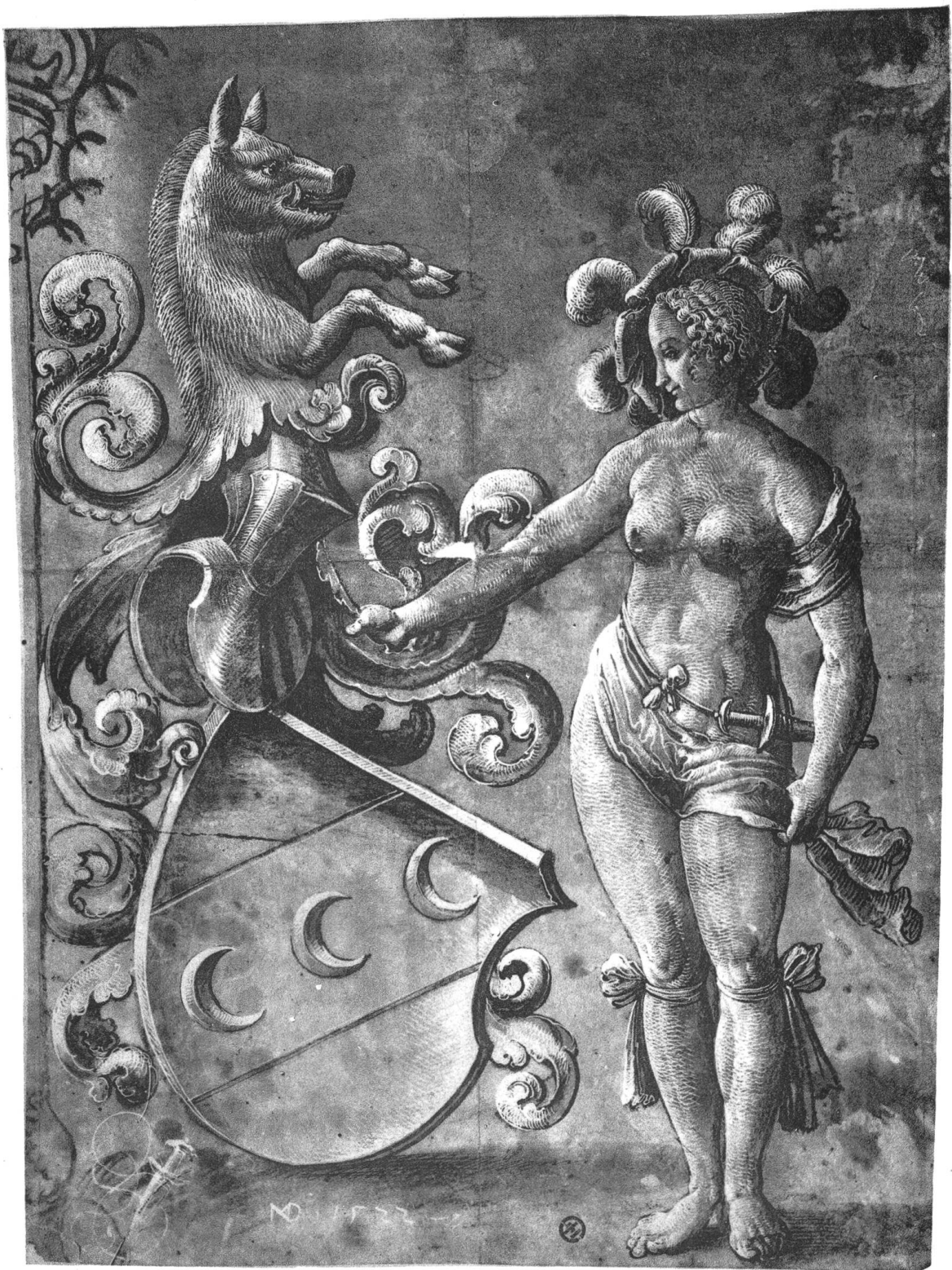
Wappen der Herren von Goldenberg (Zürich) 1522.