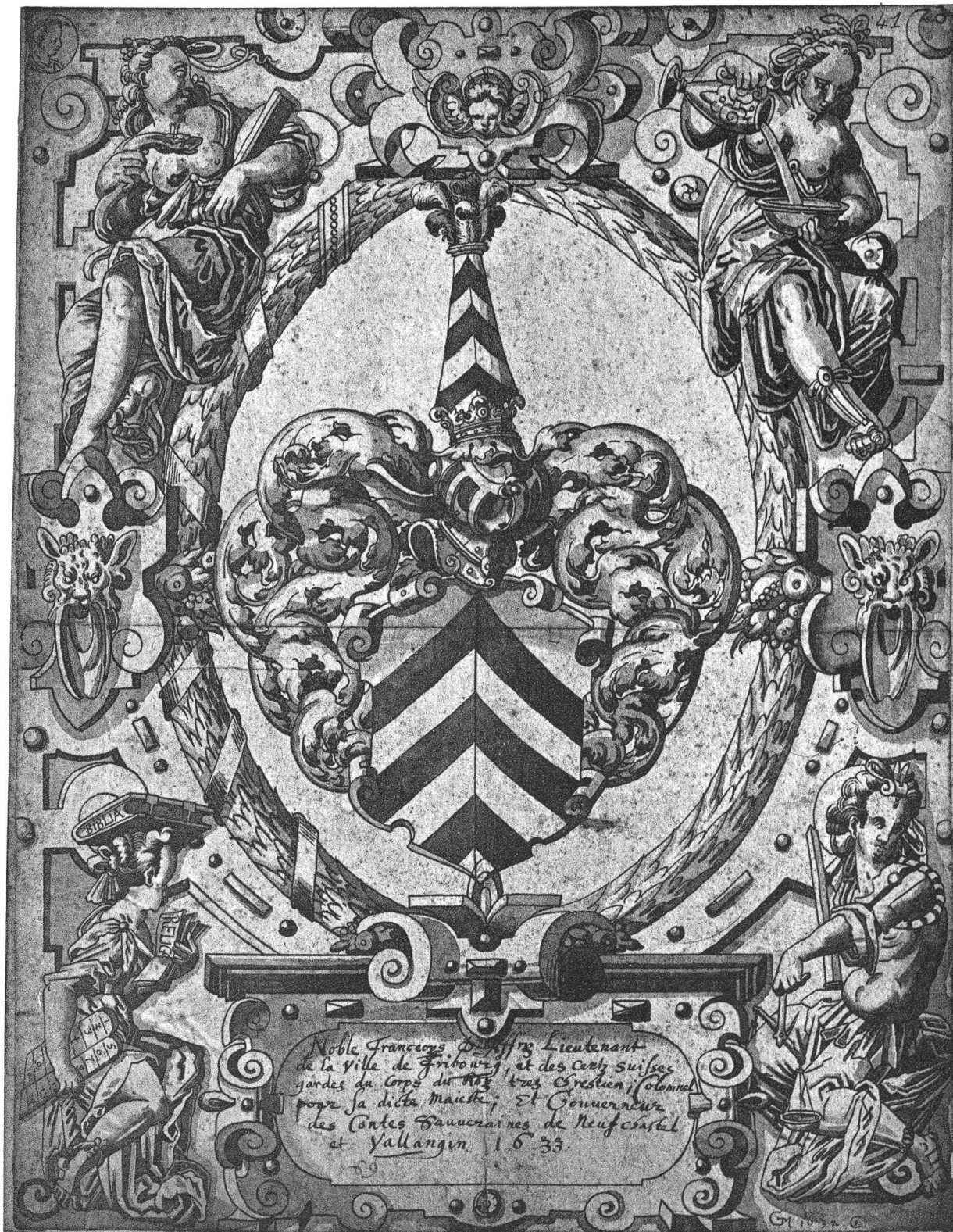
François d'Affry 1633.