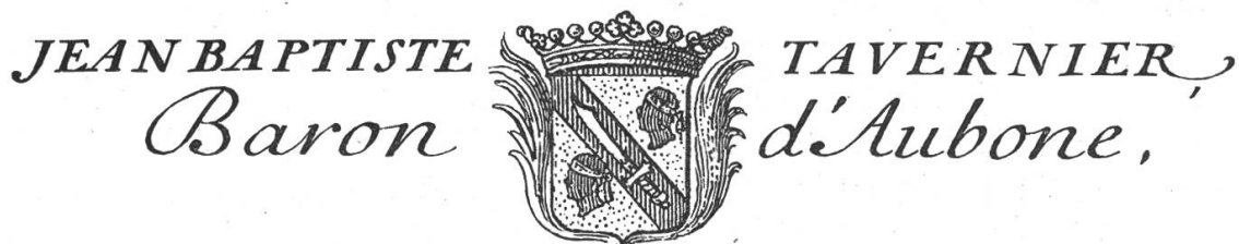
Fig. 199. Armoiries de J.-B. Tavernier figurant au-dessous de son portrait dans l'édition de 1712 de ses six voyages.

Né en 1605, il fit dès 1630 à 1668 de nombreux et importants voyages en Orient dont il publia la relation. Il fut sans contredit l'un des plus grands voyageurs français du XVII e siècle. Louis XIV le reçut auprès de lui et voulant reconnaître les services rendus par Tavernier au commerce et à la politique française, il lui accorda, en février 1669, des lettres de noblesse avec confirmation d'armoiries. Le texte de ces lettres a été publié dans la biographie de Tavernier par Ch. Joret 1) .