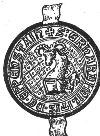
Fig. 58. Siegel Eberhard v. Eppenstein 1329.

4. 1302 ist ein Rudolf Sümer Glarner Landammann, durch Österreich ernannt. Das Geschlecht Sümer ist nicht glarnerischen Ursprunges, es war weder vorher noch nachher im Lande Glarus je mehr zu finden.