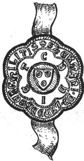
Fig. 59. Siegel Herm. v. Landenberg 1335.

Siegel von Eberhard von Eppenstein , Pfleger zu Kyburg, an Urkunde vom 21. Juli 1329 im Staatsarchiv Zürich (Fig. 58). Laut Glarner Urkundensammlung