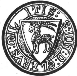
Fig. 55. Siegel Rudolf Tschudi von Glarus 1299.