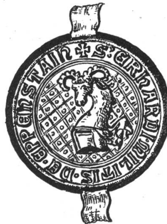
Fig. 58. Siegel Eberhard v. Eppenstein 1329.

4. 1302 ist ein Rudolf Sümer Glarner Landammann, durch Österreich ernannt. Das Geschlecht Sümer ist nicht glarnerischen Ursprunges, es war weder vorher noch nachher im Lande Glarus je mehr zu finden.