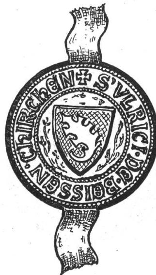
Fig. 59a. Siegel Ulrich von Wissenkilch 1331.

besiegelt dieser Ritter als Pfleger ze Kyburg und ze Glarus eine Urkunde am 10. November 1327. Umschrift: ✠ S. ERHARDI • MILITIS • DE • EPPENSTAIN.