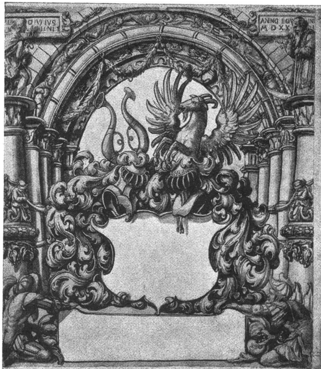
Fig. 39. Wappen der Frh. von Hewen. Scheibenriss von Hans Holbein d. J., dat. 1522 (Kunstsammlung Basel).