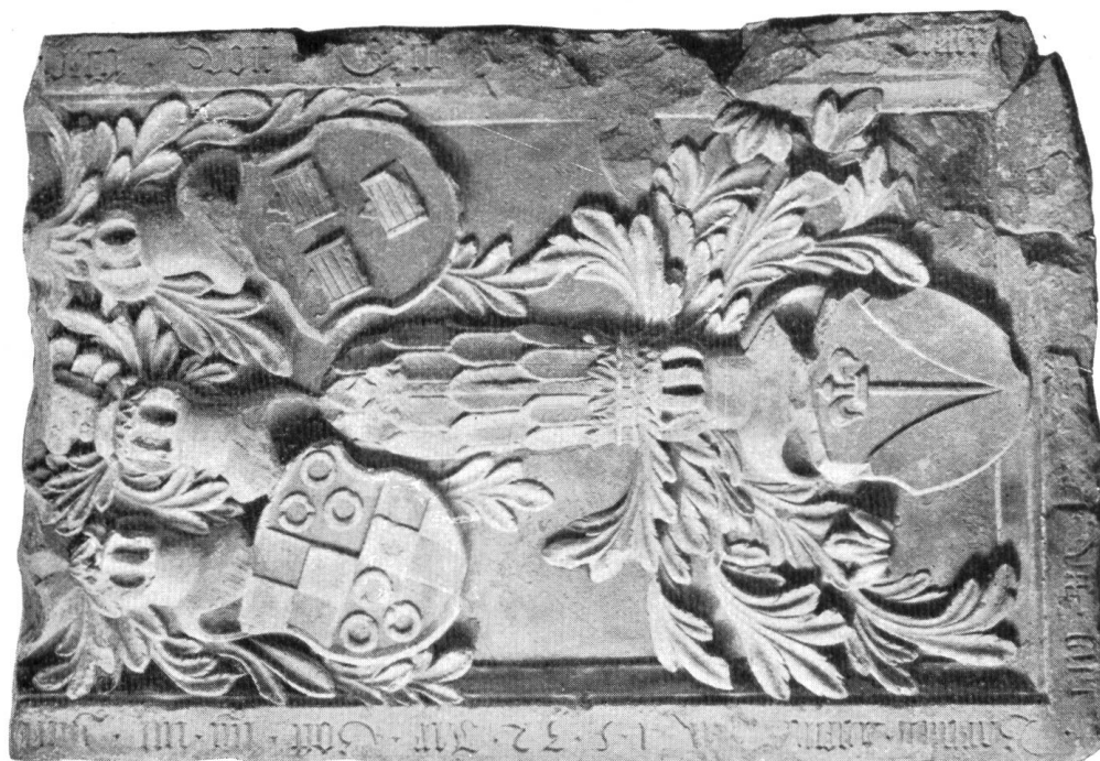
Grabstein Beringers v. Landenberg-Greifensee † 3. Dezember 1532.