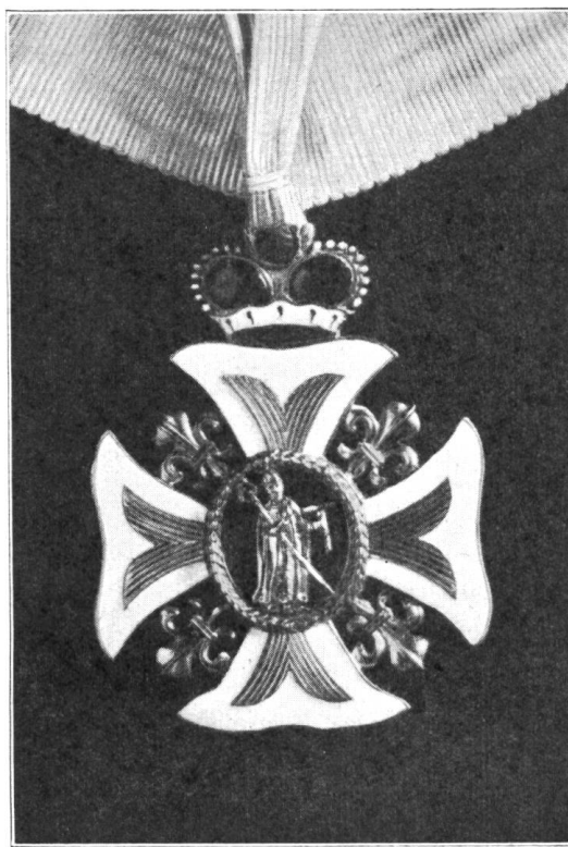
Fig. 255. Brustkreuz der Chorherren des Stiftes zu St. Leodegar in Luzern (Revers)

Nuntius und der Regierung verdankt wurden. Die Angelegenheit, insonderheit deren finanzielle Regelung, beschäftigte das Stiftskapitel dann noch bis ins Jahr 1778 hinein.