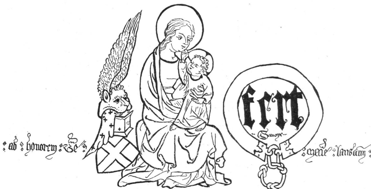
Fig. 75. En-tête de l'acte de fondation de la messe de l'aurore à la cathédrale de Lausanne par Amédée VI, comte de Savoie, en 1382.

Intercalons ici un document héraldique qui ne provient pas de la cathédrale de Lausanne, mais qui se rattache directement à son histoire. C'est une composition qui orne le haut d'un acte sur parchemin qui se trouve aux Archives d'Etat à Turin, où nous l'avons copié. C'est l'acte de fondation d'une messe perpétuelle dite de « l'aurore » par le comte Amédée VI de Savoie, le Comte Vert, acte passé à la Tour de Peilz le 29 janvier 1382. Cette messe se célébrait chaque