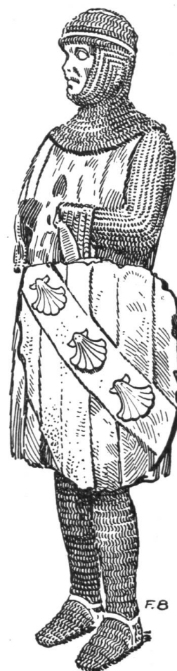
Fig. 71. Statue d'Othon de Grandson dans le chœur de la cathédrale.

Othon de Grandson fut un des membres les plus illustres de cette antique famille vaudoise. Il était fils de Pierre de Grandson et d'Agnès de Neuchâtel. Jeune homme, déjà vers 1245, nous le trouvons à la cour d'Angleterre, où il fut un des compagnons du prince héritier