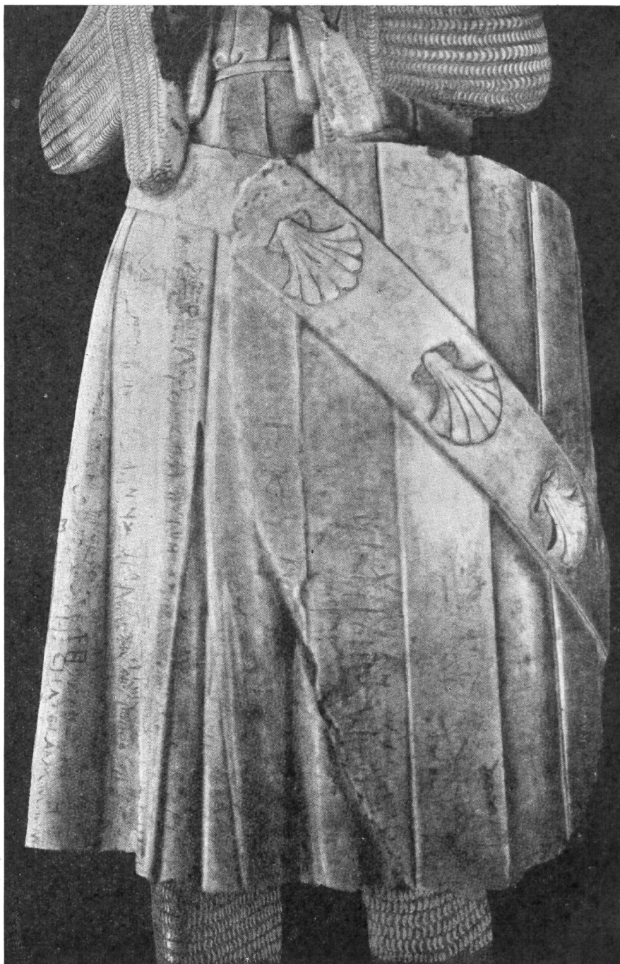
Fig. 72. Détail de la statue d'Othon de Grandson.

Edouard avec lequel il prit part à la deuxième croisade de St-Louis. Lorsque le jeune prince monta sur le trône sous le nom d'Edouard I er , il garda Othon de Grandson auprès de lui, le chargea de nombreuses missions diplomatiques