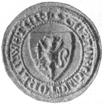
Fig. 51. Zunftsiegel vom Jahre 1378.

Am 25. August 1268 verlieh Bischof Heinrich von Neuenburg den Webern die Zunftverfassung 1) . Ursprünglich umfasste E. E. Zunft zu Webern auch die Bleicher und Färber, seit 1506 kamen hinzu die Grautücher, Linweter, Spinner, Spuler und Wollenweber 2) . Später zur Zeit der Locarner und Refugianten (um 1550) folgten noch: Passamenter (1577), Sammtweber und Seidenstoffe (1581), Seidenstreicher (1593), Heckelmänner und Seidenmüller (1597) 3) . Nach der Rangordnung der Zünfte sind die Weber die vierzehnte Zunft 4) . Der bis in das neunzehnte Jahrhundert gebrauchte offizielle Titel „Einer E. Zunft zu Leinwetter und Webern“ wird heute nur noch gekürzt mit „Einer E. Zunft zu Webern“ angewandt. Der Ausdruck Leinwetter oder Linweter stammt vom altdeutschen