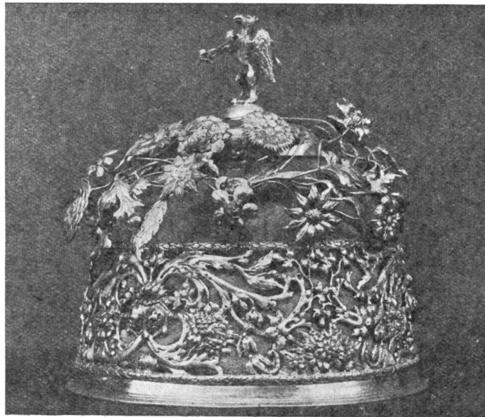
Fig. 56. Meisterkrone. Arbeit von Th. Brucker, 1710.