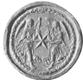
Fig. 63. Siegel E. E. Zunft zum Goldenen Stern, XVII. Jh.