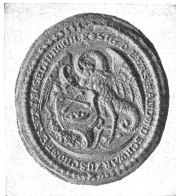
Fig. 55. Siegel der Tuchfärber.