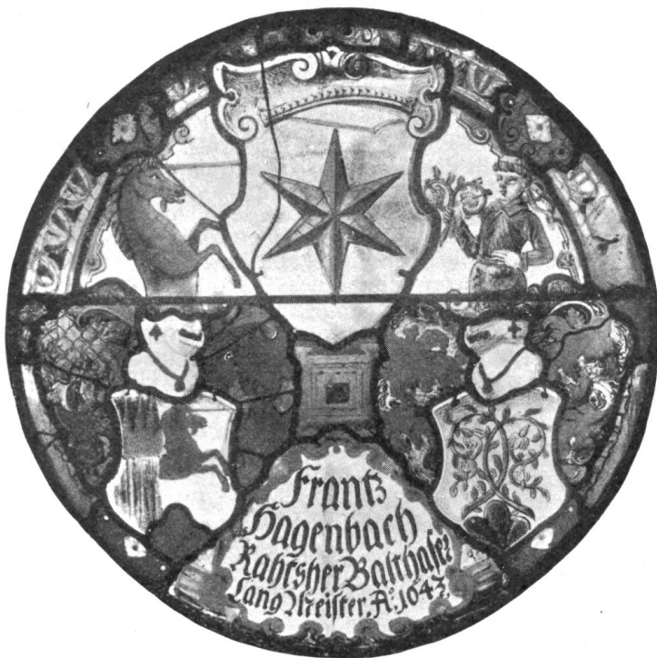
Fig. 62. Wappenscheibe E. E. Zunft zum Goldenen Stern 1643. St. Martinskirche, Basel.

Die älteste uns bekannte Darstellung des Zunftwappens befindet sich im Ord-nungsbuch E. E. Zunft zum Goldenen Stern, wo im Jahre 1467 der Schild mit dem goldenen Stern in blauem Feld eingemalt wurde 15) . Wohl nur wenig später dürfte das kleine Fähnlein der Zunft entstanden sein, welches heute im Historischen Museum