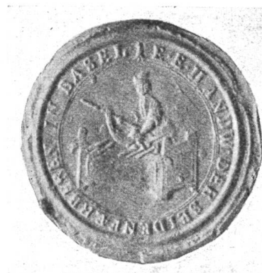
Fig. 58. Siegel der Seidenfärber.