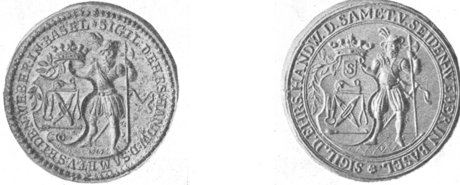
Fig. 59 und 60. Siegel der Sammet- und Seidenweber (XVIII. Jh.).

darüber ein Sammthobel und darunter ein Einzughäkchen; ein alter Schweizer mit Schwert und Hellebarde steht als Schildhalter neben dem Wappen (Fig. 59). Ein zweites Siegel aus den 1780er Jahren hat die gleiche Umschrift und Zeichnung wie dasjenige vom Jahre 1769, nur ist im Schildhaupt über dem Sammthobel ein Schildchen mit einem S beigefügt 11) (Fig. 60).