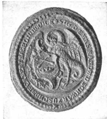
Fig. 55. Siegel der Tuchfärber.