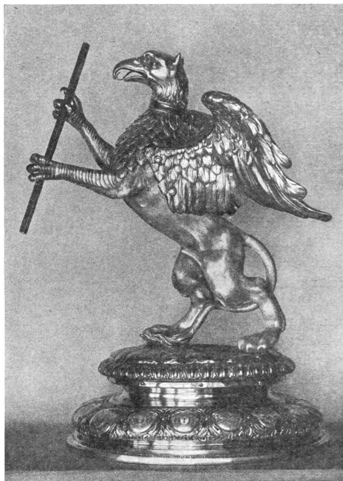
Fig. 53. Greifenbecher. Arbeit von Ph. J. Drentwett 1710.

aus der Gründungszeit der Tuchfärber ein Siegel mit folgender Inschrift: „SIG. D. EHRS. HANDW. D. SCHWARZ V. SCHÖNFÄRBER IN BASEL I. D. HOCH. EIDG. Im Vordergrund steht links ein Abkochgeschirr, worunter ein Feuer brennt, ein angeschrirtes Pferd treibt eine Farbholzmühle, im Hintergrund ein Wasserreservoir, worein sich Wasser ergiesst (Fig. 54). Aus dem Ende des XVII. Jahrhunderts ein Siegel mit derselben Umschrift wie bei Fig. 55, gevierter Schild, in einer Schale einige Blaukugeln, darüber zwei gekreuzte