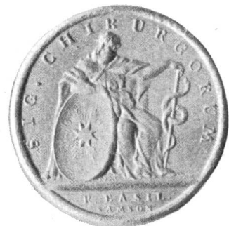
Fig. 64. Siegel E. E. Zunft zum Goldenen Stern, XVIII. Jh.

ausgestellt ist (Fig. 61). Neben dem Stern, der hier in Silber wiedergegeben ist, sehen wir ausser der Salbbüchse das Scherermesser, wie es auch auf der hübschen Rundscheibe zu St. Martin vom Jahre 1643 sich findet (Fig. 62). Zum Schluss sei noch das Zunftsiegel erwähnt, welches dem XVII. Jahrhundert zu