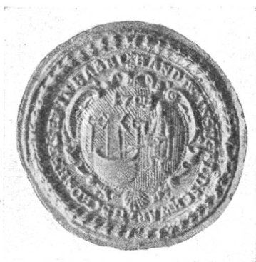
Fig. 57. Siegel der Schwarz- und Schönfärber, 1725.