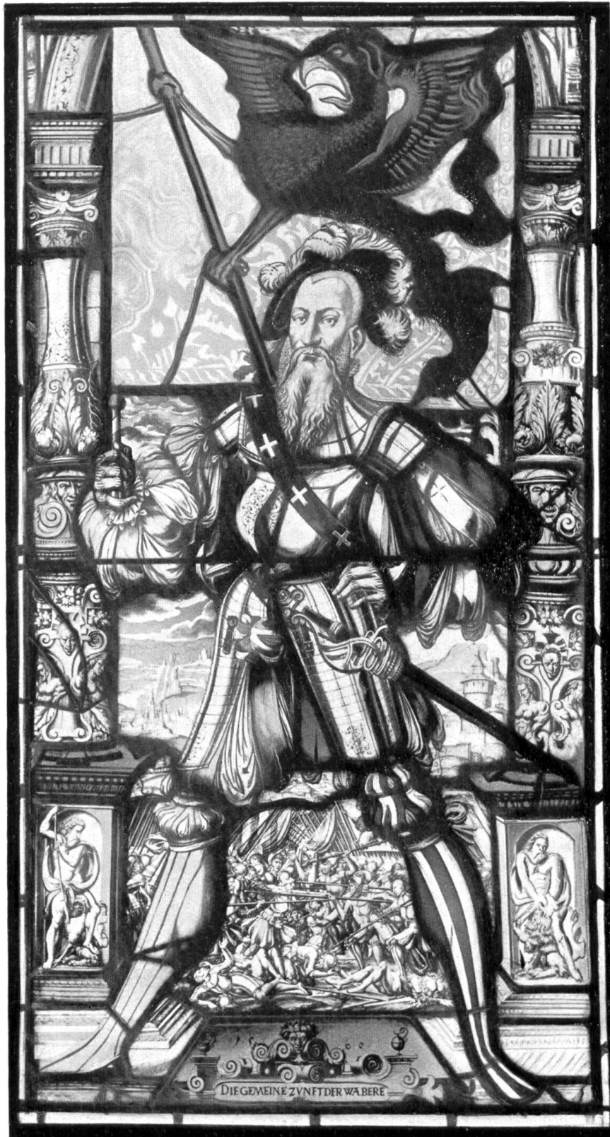
Bannerträger E. E. Zunft zu Webern. Glasscheibe von 1560 (Historisches Museum, Basel)