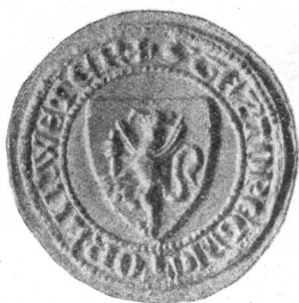
Fig. 51. Zunftsiegel vom Jahre 1378.

Am 25. August 1268 verlieh Bischof Heinrich von Neuenburg den Webern die Zunftverfassung 1) . Ursprünglich umfasste E. E. Zunft zu Webern auch die Bleicher und Färber, seit 1506 kamen hinzu die Grautücher, Linweter, Spinner, Spuler und Wollenweber 2) . Später zur Zeit der Locarner und Refugianten (um 1550) folgten noch: Passamenter (1577), Sammtweber und Seidenstoffe (1581), Seidenstreicher (1593), Heckelmänner und Seidenmüller (1597) 3) . Nach der Rangordnung der Zünfte sind die Weber die vierzehnte Zunft 4) . Der bis in das neunzehnte Jahrhundert gebrauchte offizielle Titel „Einer E. Zunft zu Leinwetter und Webern“ wird heute nur noch gekürzt mit „Einer E. Zunft zu Webern“ angewandt. Der Ausdruck Leinwetter oder Linweter stammt vom altdeutschen