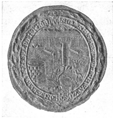
Fig. 54. Siegel der Tuchfärber.