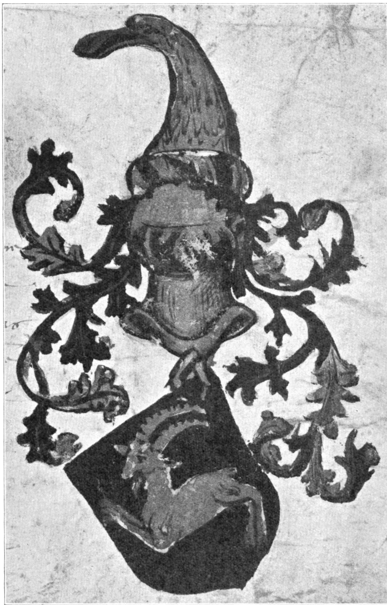
Fig. 39. Armoiries peintes sur le diplôme Griset de 1527.

du Conseil des LX. Il s'était établi à Corcelles. Lorsque cette localité se sépara de Payerne, en 1806, pour former une commune indépendante, il opta pour cette dernière, dont il fut un des premiers municipaux. Cinq de ses fils optèrent aussi pour Corcelles, tandis que les quatre autres optèrent pour Payerne. La famille des nobles Fivaz est représentée aujourd'hui par les descendants de ces neuf frères.