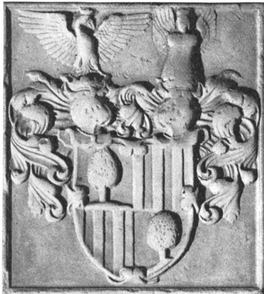
Fig. 134. Grabmal des Freiherrn Rudolf, † 1600. Basel, Münster.

Rudolf von Salis , geboren 1529, als der ältere Sohn des Obersten Herkules (1503—1578) zu Chiavenna und Soglio, diente zuerst in Frankreich in den Regimentern Unterhalden und Fröhlich; 1560 (13. und 16. Mai) schliessen der Vater und seine beiden Söhne Rudolf und Abundius eine Militär-Kapitulation mit Venedig für vier resp. sechs Jahre, ersterer als Oberst, letztere als Hauptleute; doch rückt Rudolf, da der Vater in Rücksicht auf sein Alter resigniert, schon am 1. Juni zum Obersten vor 9) . 1565 wird Rudolf wegen angeblich hochverrätherischer Verbindung mit Venedig, Spanien und dem Kaiser von den Engadineren gefangen genommen, nach Zuoz geschleppt und grausam gefoltert („bis uff den tod gestreckt“), schliesslich aber doch „als ein ehrlicher vom Adel“ ledig gelassen 10) . Im folgenden Jahre tritt Rudolf in die Dienste des Kaisers Maximilian II., seines besonderen Gönners, und wird gleich zum „Obersten Feldzeugmeister“ in Ungarn und Siebenbürgen bestellt und 1570, weil im Krieg lahm geschossen, mit