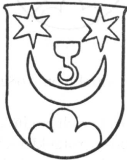
Fig. 41 (1768)