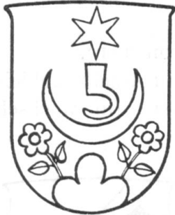
Fig. 34 (1670)

Schild blau. Lohnen schwarz. Schrägbalken, Stern und Monde gelb. Dreiberg grün. Helmzier: blauer Flügel mit dem Schildbild. Decken blau-gelb.