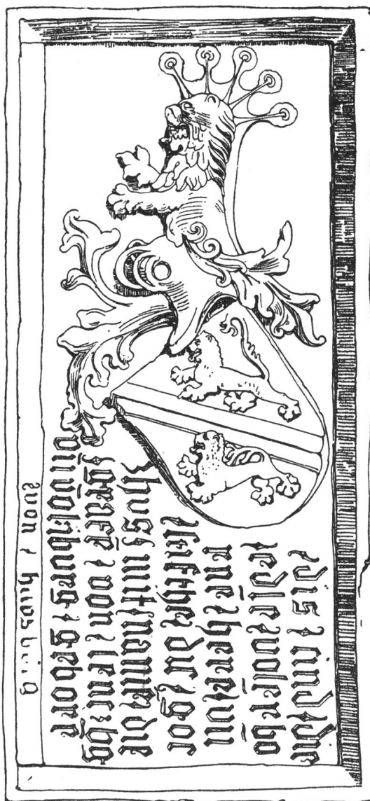
Fig. 167. Epitaphium des Stifters mit dem Wappen der Linie Habsburg-Laufenburg aus dem Anfang des XVI. Jahrhunderts in der Krypta der Kirche Schännis.