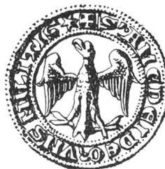
N° 70. Oron. 1267.