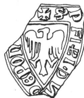
N° 73. Pontverre. 1258.