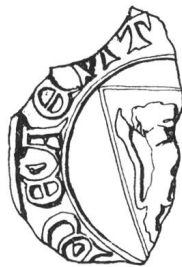
N° 51. Ayent. 1269