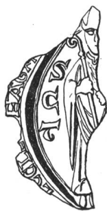
N° 95. Guillaume I er , 1178/1198.