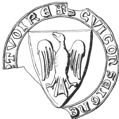
N° 72. Pontverre. 1238.