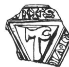
N° 65. Martigny. 1269.