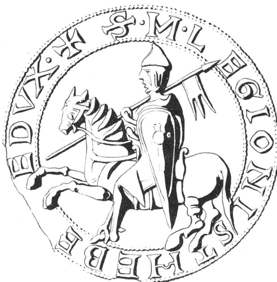
N° 93. Le Chapitre. XII e siècle.