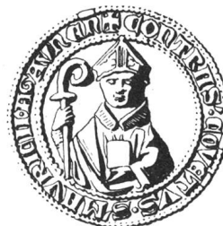
N° 94. Le Chapitre, 1303.