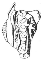
N° 100. Pierre I er , 1280.