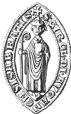
N° 98. Girold, 1262.