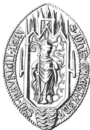
N° 113. Jean II, 1379.