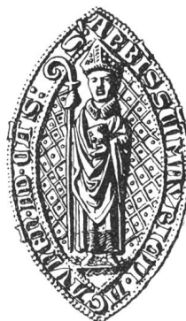
N° 109. Barthélemy II, 1349.