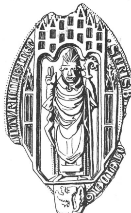
N° 108. Barthélemy II, 1351.