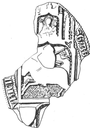
N° 111. Girard II, abbé, 1376.