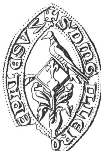
N° 71. Palézieux. 1242.