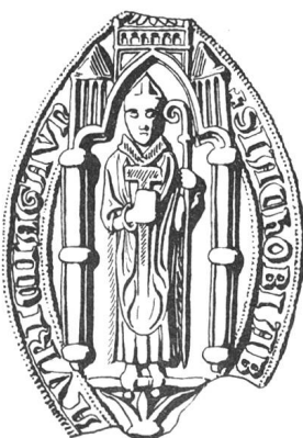
N° 103. Jacques, 1293.