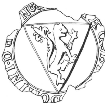
N° 59. Conthey. 1249.