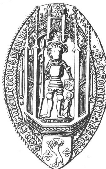
N° 120. Pierre II, 1434.