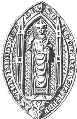
N° 106. Barthélemy I er , 1318.