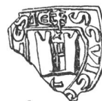
N° 60. Criez. 1296.