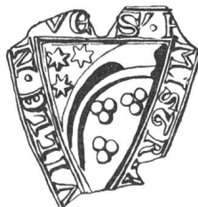
N° 66, Métral de Villeneuve. 1263.