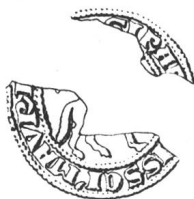
N° 102. Girard, abbé, 1291.