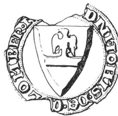
N° 58. Collombey. 1267.