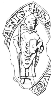
N° 97. Nantelme, 1257.