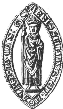
N° 105. Jacques, 1296.