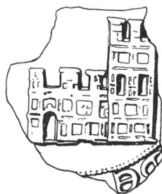
N° 62. La Tour-Châtillon. 1258.