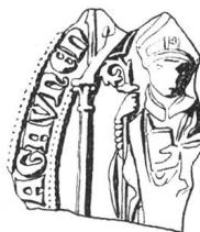
N° 101. Girard I er , 1291.