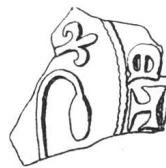
N° 80. Saillon. 1258.