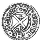
N° 119. Guillaume II, 1428.