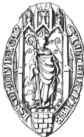
N° 110. Jean I er , 1358.