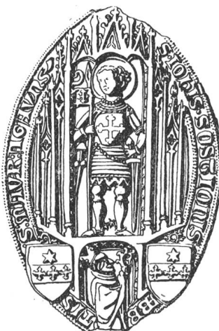
N° 116. Jean III, 1414.