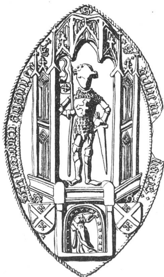
N° 118. Guillaume II, 1428.