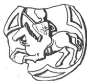
N° 115. Jean II, abbé, 1402.