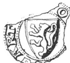
N° 52. Blessens. 1294.