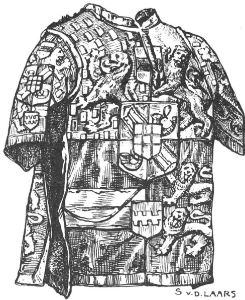
Fig. 87. — Manteau d'un héraut d'armes (Musée royal).

Les prétentions des Châlon à cette succession les mirent pendant un quart de siècle en compétition avec les comtes de Savoie. Ce n'est qu'en 1424, par un traité passé à Morges, que le prince Louis d'Orange céda au duc Amédée VIII tous