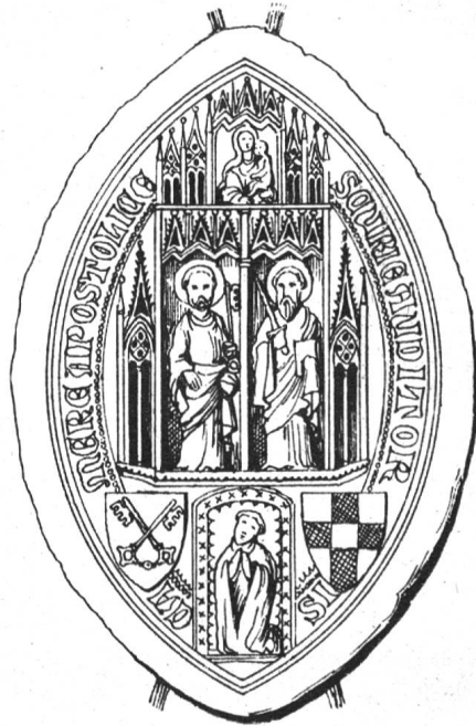
Fig. 151. Sceau de la cour de l'auditeur apostolique sous Clément VII.

Un sceau de Clément VII comme cardinal a déjà été publié dans les Archives héraldiques en 1917 (p. 103, fig. 76).