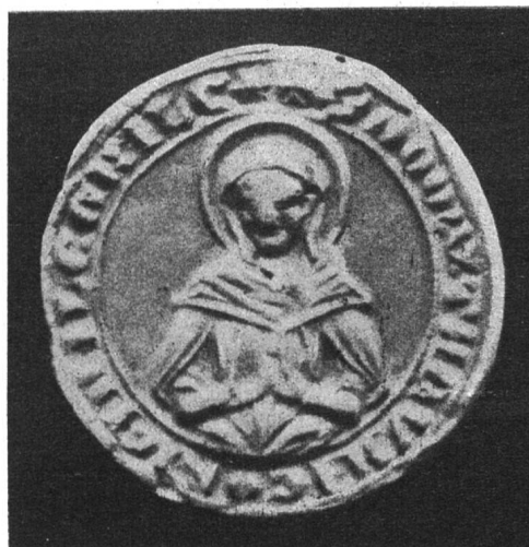
Fig. 152. Siegel der Kommende Hitzkirch.

Trotzdem ist der verdienstvolle Verfasser nicht zufrieden. Sehr resigniert äussert er sich über « die Enttäuschung, die allen denen beschieden sei, die sich mit den Ritterorden befassen ». Das ist nicht wunderbar. Die trockenen Akten konnten ihm nur die finanzielle Seite zeigen, nur die Verwaltung des Vermögens des Ordens, nur die Beschaffung der Mittel, die er brauchte, um den langen Kampf zu führen. Von dem reichen Leben, was da sich täglich abspielte, kommt darin nur wenig zum Vorschein, wenngleich doch hie und da blasse Spuren davon aufleuchten. Da bringen die Statuten des Ordens schon mehr, aus denen er recht anschaulich die Organisation der Komtureien zusammengestellt hat (Kap. 2).