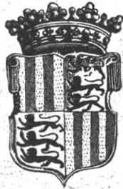
Fig. 75. Wappen des Königl. Kollegiatstiftes über der Pforte der Propstei in Solothurn.

aus dem herzoglichen Hause Schwaben stammen, weshalb man ihr auch das Wappen dieses Geschlechtes : drei schreitende Löwen beigab. Ohne Zweifel haben wir bei Stumpf die Quelle zu suchen, woraus das Kapitel von Solothurn die Nach-