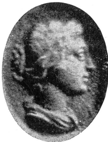
Fig. 212. (Agrandissement)