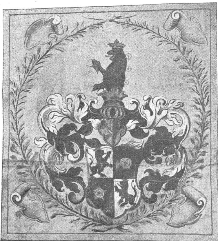
Fig. 5 Armoiries peintes sur le diplôme Vissaula, 1637.

Löwen, mit einer guldenen Cron, Zungen, Klawen oder Griffel, auch auffgerichteten Schweiff. Inn den ändern zweyen rothen Veldierungen ein weisse fünfblätterige Rosen, das mittler darin Guldin, und disses wegen seiner und der seinigen besonders gemelten Rittmeisters Mann- und Kuenheit, welchisse muth sich einem Löwen und Tugent einer lieblich rosen zuuergleichen; ob dem Schilt ein offenen Turniershelm, auff der rechten und linken Seiten (inwendig mit rother und aussuendig mit weisser farb) zurück fliegender Helmdecke, mit einer guldenen Cron geziert, darauff ein halb rother Löw, mit einer guldenen Cron gekrönt und am Ruggen mit dreyen weissen Rosen belegt, wie dan das Wappen und Kleinloth in diesem Unserm Brieff gemahlet und mit seinen farben eigentlich aussgestrichen stehet.