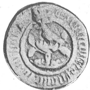
Fig. 101 Kleines Siegel der Stadt Arbon.

Die Nachricht des Herrn Verfassers, es sei das nebenstehende Wappen von einem Zeichnungslehrer im Stadtarchiv Zürich entdeckt worden, dass es wahrscheinlich aus dem 16. Jahrhundert stamme usw., braucht auf ihre Richtigkeit nicht nachgeprüft zu werden. Es ist vollständig belanglos, ob wirklich ein Maler des 16. Jahrhunderts oder ein Zeichnungslehrer der modernen Schule dieses Bild gefunden, erfunden oder entworfen habe, massgebend für ein Wappen der Stadt Arbon ist nur das alte Siegelbild, weil wir es tatsächlich besitzen, und weil es weit vor dem 16. Jahrhundert erscheint. Wenn es auch zufällig auf Rechtsalter-