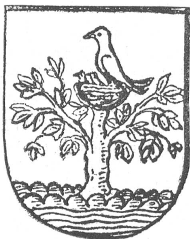
Fig. 102 Wappen der Stadt Arbon (Vorschlag).

Die nebenstehende Skizze, Fig. 102, gilt daher als Vorschlag für ein Wappen der Stadt und der Gemeinde von Arbon. Es ist Sache des jeweiligen ausführenden Künstlers, die Formen zu vollenden. Als Farben seien in Vorschlag gebracht: Zu Füßen der blaue See und darüber gepflügte, silbernes Ackerfeld. Über diesen die rote Schildfläche mit grünem Baum. Auf demselben silbernes Vogelnest mit alten und jungen schwarzen Vögeln (wohl Raben).