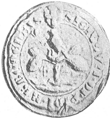
Fig. 100 Grosses Siegel der Stadt Arbon.