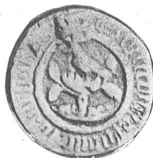
Fig. 101 Kleines Siegel der Stadt Arbon.

Die Nachricht des Herrn Verfassers, es sei das nebenstehende Wappen von einem Zeichnungslehrer im Stadtarchiv Zürich entdeckt worden, dass es wahrscheinlich aus dem 16. Jahrhundert stamme usw., braucht auf ihre Richtigkeit nicht nachgeprüft zu werden. Es ist vollständig belanglos, ob wirklich ein Maler des 16. Jahrhunderts oder ein Zeichnungslehrer der modernen Schule dieses Bild gefunden, erfunden oder entworfen habe, massgebend für ein Wappen der Stadt Arbon ist nur das alte Siegelbild, weil wir es tatsächlich besitzen, und weil es weit vor dem 16. Jahrhundert erscheint. Wenn es auch zufällig auf Rechtsalter-