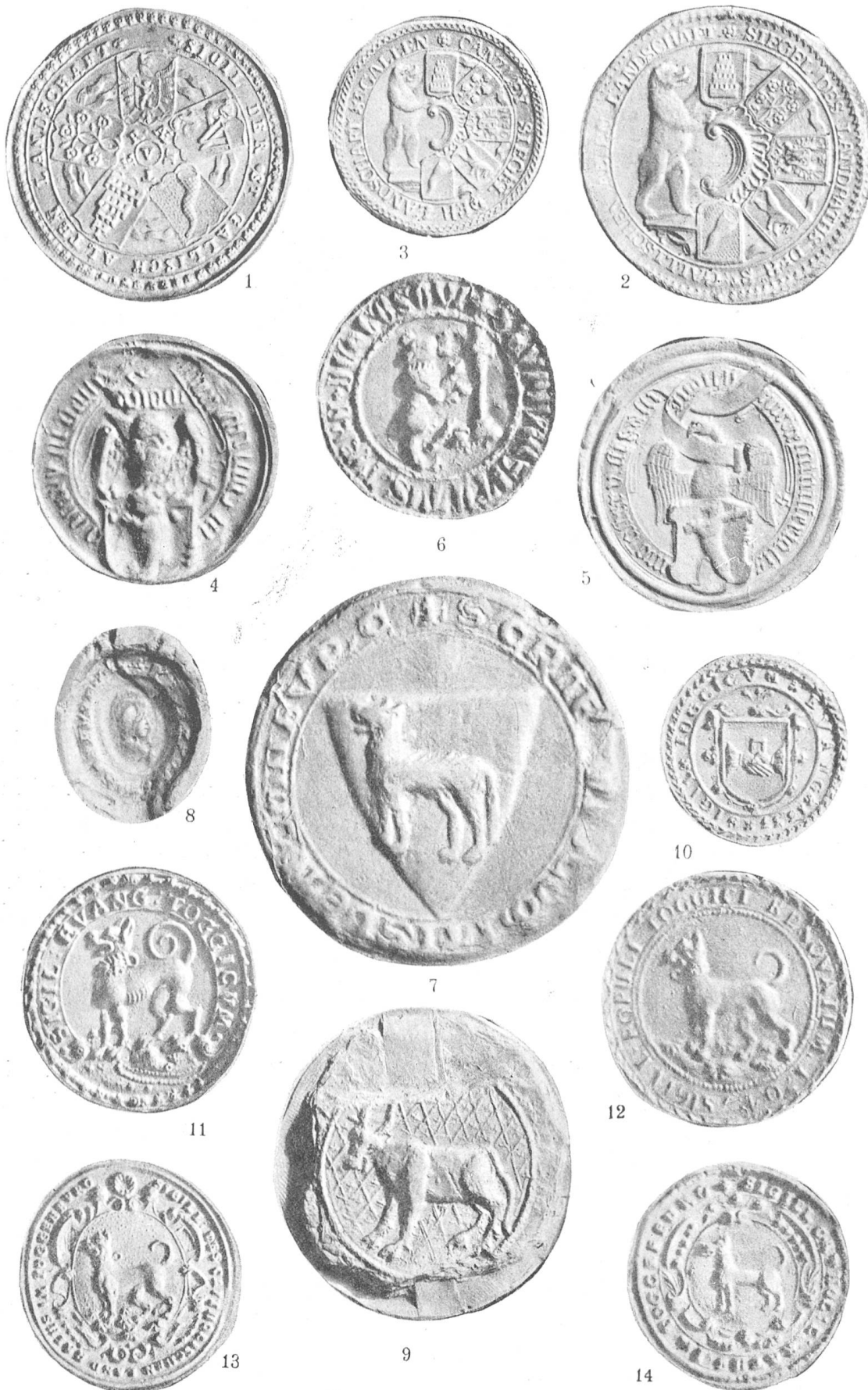
Siegel der St. Gallischen Unterthanenländer