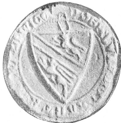
Fig. 149 Siegel der Bürger von Weesen (1316).