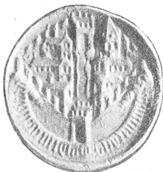
Fig. 146 Stadtsiegel von Wallenstadt aus dem 15. Jahrhundert.