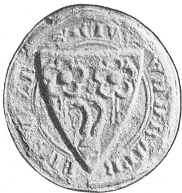
Fig. 150 Siegel von Rapperswil (1306).

Als kleiner, aus wenigen Fischerhütten bestehender Ort an der Endinger Landzunge, tritt Rapperswil in die Geschichte ein. Ein mächtiges und edles Geschlecht, über dessen frühe Genealogie die Geschichte vielleicht nie sicheren Aufschluss erhalten wird, baute sich hier eine neue Heimstätte, nachdem der