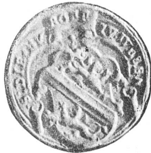
Fig. 148 Siegel von Weesen aus dem 17. Jahrhundert.

Das Wappenbild von Weesen ist bis vor kurzem nur in einem modernen, höchstens dem 17. Jahrhundert angehörenden Siegel des Ortes