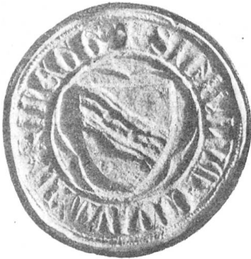
Fig. 95 Stadtsiegel von Rheineck aus dem 14. Jahrhundert.

liches Vorkommen wir zwar nicht mehr genau bestimmen können, das aber die älteste bildliche Darstellung des Stadtwappens zeigt (Fig. 95). Im schrägen Wellenbalken drei hintereinander schwimmende Fische, die ohne Zweifel als ein redendes Wappen zu deuten sind. Also Fische für Fischerhusen. Der Wellenschrägbalken versinnbildlicht den Rhein.