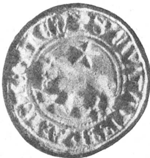
Fig. 96 Stadtsiegel aus dem 14. Jahrhundert.

(Meieramt. Hof und Stadt. Politische und Ortsgemeinde im Bezirk Oberrheintal).