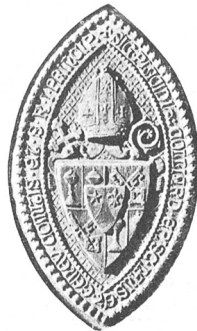
Fig. 63 Grand sceau de Mgr Colliard.

Les héraldistes suisses apprendront avec plaisir que Mgr Colliard cultive depuis longtemps avec passion, dans ses moments perdus, le « noble savoir ». Connu comme héraldiste, la Société d'histoire lui confia en 1902 le soin de rassembler et d'étudier les armoiries communales du Canton de Fribourg, mais à cause d'un surcroît de travail puis de son éloignement du Canton il dut renoncer à ces recherches et ce travail fut alors remis à l'auteur de ces lignes. Mgr Colliard a toujours suivi avec le plus vif intérêt les travaux de la Société suisse d'héraldique. Nous le comptons dès 1902 parmi les abonnés de nos Archives héraldiques suisses et en 1910 il se fait recevoir membre de notre société. Il espérait toujours reprendre une fois, lorsque le temps le lui permettrait, ses études de prédilection, mais sa paroisse l'absorbait de plus en plus et dans une lettre qu'il nous adressait en mai 1909 il évoquait « des projets amoureusement caressés autrefois et qu'il ne pourrait jamais exécuter », et nous parlant de sa grande paroisse du Locle, il ajoutait: « j'ai dû dire adieu à bien des choses et j'en suis réduit à suivre des yeux la marche des autres et à applaudir à leurs travaux en regrettant de n'y pouvoir prendre part ».