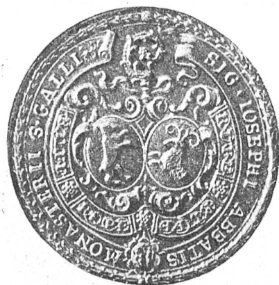
Fig. 116 Sceau du prince-abbé Joseph von Rudolphi.

Les abbés de St-Gall portaient en général leurs armes écartelées avec celles des abbayes de St-Gall et de Neu St. Johann et celles du comté de Toggenbourg, soit au 1 er d'or à l'ours rampant de sable tenant un tronc du même sur son épaule (de l'abbaye de St-Gall), au 2 e d'azur à l'agneau pascal d'argent (de l'abbaye bénédictine de Sankt Johann incorporée à celle de St-Gall en 1555 et transférée de Alt St. Johann à Neu St. Johann en 1626); au 3 e les armes personnelles de l'abbé et au 4 e d'or au chien passant de sable colleté d'argent (du comté de Toggenbourg dont les abbés de St-Gall étaient seigneurs).