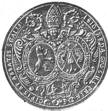
Fig. 121 Sceau du prince-abbé Beda Angehrn.

Ce fut l'abbé Beda qui fit construire la « Neue Pfalz » et c'est à lui que l'on doit l'acquisition, en 1768, des célèbres manuscrits du chroniqueur Tschudi parmi lesquels se trouvait le Breviarium Alaricianum et le Chant des Niebelungen .