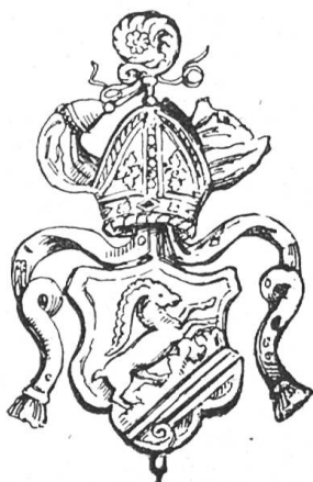
Fig. 65 Wappen des Abtes Nikolaus v. Flüe von Wettingen (1641–1649) nach dessen Grabstein daselbst.

Die Quelle des von Chorherr Schufelbüel vermittelten Wappenbildes ist also keineswegs die alte Münsterer Tradition, sondern zweifellos ein Siegel der