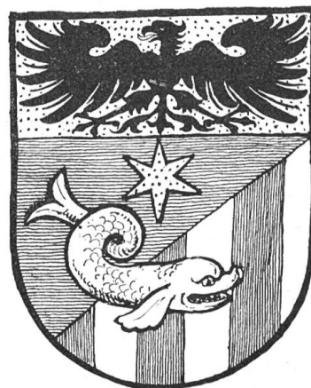
Fig. 72 Lungern.

Lungern. Schräggeteilt. Im obern blauen Feld ein goldener Stern, das untere fünfmal rot-weiss gespalten. Über das ganze ein weisser, delphinartiger Fisch. Gelbes Schildhaupt mit schwarzem, einfachem Adler. — Das fremdartige Wappenbild ist augenscheinlich ganz neuern Ursprungs. Britschgi schreibt, es liege im Original in seinen Händen „und wurde in dorten selbst unter alten Schriften als Titel eines Gemeindeprotokoll gefunden.“ Er deutet das Schildhaupt auf das älteste Landeswappen von Hasle, „weil die Lungerner in der bernischen Reformation einige wenige von Meiringen sich flüchtende Familien als Gemeindebürger aufgenommen“!! Kiem fand das Wappen „merkwürdig“ und erklärte den „Delphin“ damit, dass in der Gemeinde ein fischerreicher See sich befinde. Man könnte darin weitergehen und direkt eine Anspielung auf den berühmten Gespensterfisch im Lungerner See erblicken 2 . Aber alle Hypothesen sind überflüssig, denn eine Zeichnung aus dem Anfang des 19. Jahrhunderts im Familienarchiv Wyrsh in Buochs, die aus v. Flüeschem Besitz stammt, zeigt klar, dass dieses Wappen einer der berühmtesten italienischen Wappenfabriken entstammt. Sie zeigt das obige Wappen mit grün tingiertem Delphin und der Unterschrift: „Wappen Lüngeren, gehoben aus denen wahren alten Büchern von Antonio Bonacina in Santa Margritagasse bey dem Cruzifix in Mayland“. Damit werden wir jeder weitem Nachforschung enthoben.