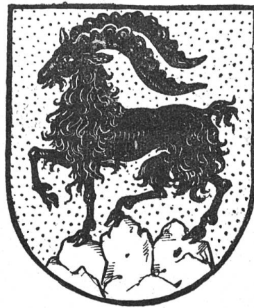
Fig. 63 Sachseln.