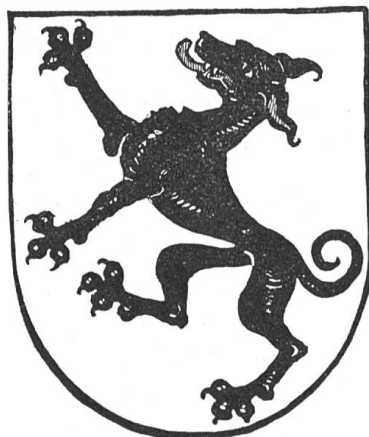
Fig. 68 Giswil.