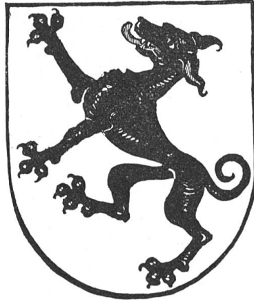
Fig. 68 Giswil.