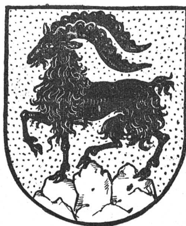
Fig. 63 Sachseln.