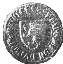
Fig. 70 Siegel des Heinzmann von Hunwil 1385.

Im Gemeindesiegel von ca. 1820 ist das Bild etwas verändert. Wir sehen einen von einem Engel gehaltenen, vom Auge Gottes im Dreieck überstrahlten quergeteilten Schild. In dessen oberer blauer Hälfte der Hund schreitend, die untere Hälfte fünfmal gespalten. Bei der erwähnten Gemeindewappen-Enquête im Jahre 1870 erlitt aber das Giswiler Wappen abermals eine Veränderung. Der Gewährsmann W. Britschgi schrieb an den Kanzleidirektor: „Das Wappen von Giswyl ist nach dem Petschaft der Gemeindebehörde gezeichnet, nur mit dem Unterschiede, dass der Strich oder die Linie, auf welcher der Hund steht, dort wagrecht graviert ist, während ich auf Aussage zweier Heraldikkenner (Freunde) denselben schräge ansteigend zeichnete, indem nach angeführten Meinungen die erstere Linie nicht, wohl aber die genannte heraldisch richtig sei (!!). Es solle ferner ein auf diese Art ausgeführtes Wappen in irgend welcher