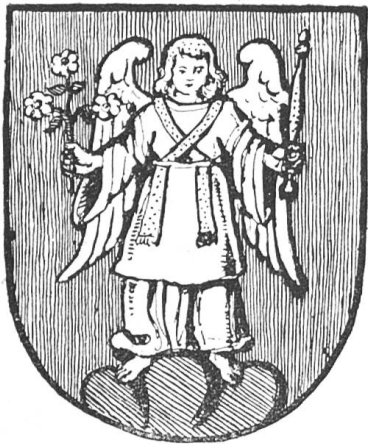
Fig. 73 Engelberg.

über dem Stiftswappen besteht im Fehlen des goldenen Sterns, der das linke Obereck des letztern schmückt. Dieser sechszackige Stern heisst darum noch heute bei alten Talleuten der „Herrenstern“ und wird als abbreviiertes Wappenzeichen des Klosters selbständig verwendet, so z. B. als Schmiedemarke vom Klosterschmied und als Holzmarke 1 . Diese Bedeutung ist wohl schon dem Stern an der Giebelfassade der Stiftskirche und im Wetterfähnlein über dem Eingangstor zuzuerkennen.