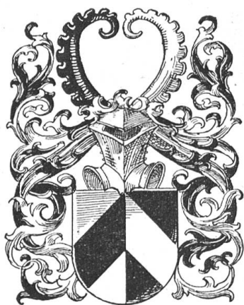
Fig. 45 Sürilin (Zehg. Roschet).

1432 Oberstzunftmeister und erhält d. d. Pressburg am 6. Dezember 1434 mit seinem Bruder Dietrich und seinem Neffen Hans Kunrad Sürilin von Kaiser Sigmund einen Wappenbrief, der wohl nur das alte Wappen des Geschlechts bestätigte.