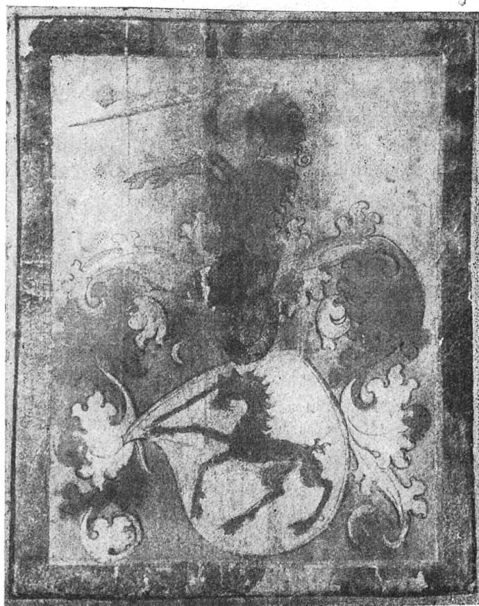
Fig. 62 David.

„mit namen sein einen schiltte in mitte überzwirch gleich geteilt das unnder swartz darin in mitte ein rotte laisten unnd das oberteil weis oder Silberfarb darin ein vorderteil eines Rotten Leo mit seinen ausgerakhten fuessen gelben kloen aufgeworfen krumben swantz aufgetanem maul unnd ausgeslagner rotten gelfunde Zungen und auf dem Schiltt einen helm getzieret mit einer roten und swartzen helmdekken darauf auch ein vorderteil eines rotten leo mit ausgerakhten fuessen gelben Cloen aufgetanem maul unnd ausgeslagnen Zungen.“