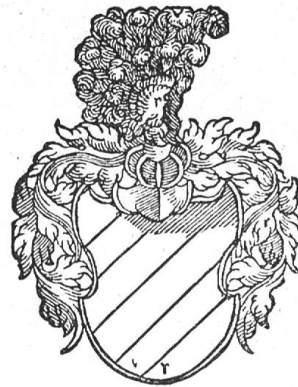
Fig. 56 von Brunn (nach Wurstysen).