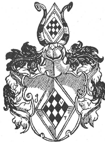
Fig. 59 Oberried (nach Wurstysen).