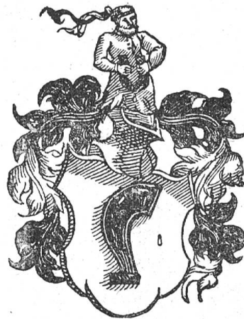
Fig. 55 Halbysen (nach Wurstysen).

Das Original des Wappenbestätigungsbriefes wurde zu Beginn des achtzehnten Jahrhunderts von Johann von Brunn mitgenommen, der nach Mainz