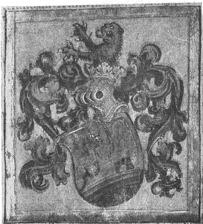
Fig. 61 Kilchman