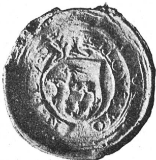
Fig. 64 Siegel des Landammanns Nikolaus v. Flüe 1557.

von Tit. Herrn Inspektor und Chorherrn Xaver Schufel- büel von Münster anher geschickt und in unser Stam- menbuch hier eintragen worden“. — Darnach bestellte man den 7. April 1815 den noch heute gebrauchten Siegelstempel bei Bruppacher in Wädenswil 1 .