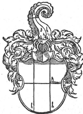
Fig. 44 v. Hegenheim (nach Wurstysen).

Q: W. Altmann, Reg. K. Sigm. Nr. 10977. — Aug. Burckhardt, Basler Jahrbuch 1909, 109. — Basler Chroniken VII, 348/9.