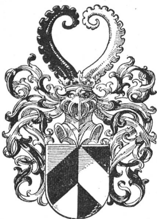
Fig. 48 Sürilin (Zchg. Roschet).

14. König Friedrich gibt den Brüdern Hans und Dietrich Sürilin und deren Neffen Hans Kunrad Sürilin eine Wappenbesserung. 24. September 1442. König Friedrich verlieh d. d. Zürich am 24. September 1442 dem Hans Sürilin, seinem Bruder Dietrich und seinem Neffen Hans Kunrad Sürilin eine Wappenbesserung, die in einer goldenen Krone auf dem Helm bestand. Eine Wappenbestätigung hatten sie im Jahre 1434 durch Kaiser Sigmund erhalten.