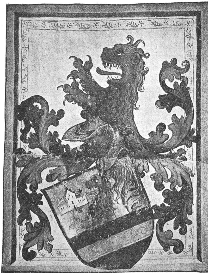
Fig. 47 Kilchman

auf dem Schilde einen Helm dorauf ein roter leo mit zwein aufgereckten tatzen und ausgereckter Zungen als in dem Schilde, mit einer swartzen und roten Helmdecke“.