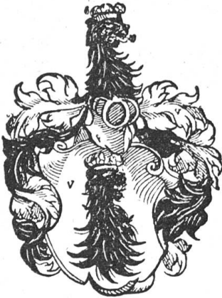
Fig. 57 Irmi (nach Wurstysen).

Q: Gütige Mitteilung aus der Familie, für welche hier nochmals mein allerbesten Dank ausgesprochen sei. — J. Chmel, Reg. Frid Nr. 6331. — Altes Wappenbuch E. E. Zunft zum Schlüssel. — R. Wackernagel, Geschichte der Stadt Basel 2. II. 869 ff.