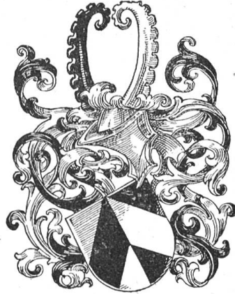
Fig. 43 Eriman (Zehg. Roschet).

Q: W. Altmann, Urk. Kaiser Sigm. Nr. 10979. — W. Merz, Die Burgen des Sigtaus I.