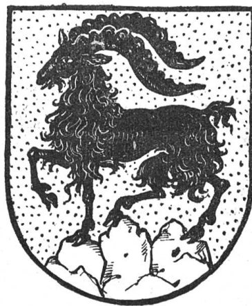
Fig. 63 Sachseln.