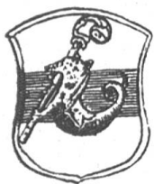
Fig. 28 Armoiries de l'Ajoie d'après un armorial du XVIII e siècle.

Il existe peu d'anciens documents représentant ces armoiries. Nous les reproduisons ici d'après un armorial manuscrit du XVIII e siècle des archives de Delémont (fig. 28).