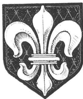
Fig. 51 Armoiries de St-Prex.

St-Prex est un ancien petit bourg fortifié qui appartenait au Chapitre de Lausanne. Il est situé sur un promontoire du lac Léman. Il compte actuellement 700 habitants et fait partie du district de Morges.