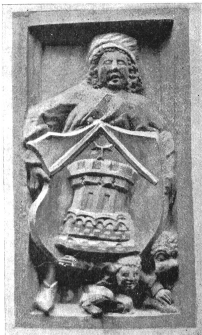
Fig. 47 Wappen des Antonius Lyasse de Turre-Pini.

Geistlichkeit der Gemeindekirche bestimmte Solennitäten statt gemäss einer im Jahre 1480 zwischen dem Präzeptor des Ordens und dem Leutpriester von St. Theodor getroffenen Vereinbarung.