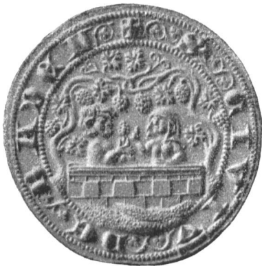
Fig. 132 Erstes Stadtsiegel von Baden nach dem Originalstempel.

führt als Wappen dasjenige der Stadt, wonach er benannt ist.