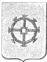
Fig. 128 Wappen von Mül- hausen auf dem Diplom v. 6. April 1826 (verkleinert)

Bis zum Jahre 1870 bediente sich die Stadt Mülhausen des amtlichen Siegels mit dem neuerdings erhaltenen Wappen. Nach der Einverleibung Elsass-Lothringens mit Deutschland mussten sämtliche Gemeinden, infolgedem auch die unsere, auf ihrem Siegel den kaiserlichen Adler anwenden mit entsprechender Abänderung der Inschrift.