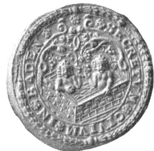
Fig. 134 Sekretsiegel von Baden nach dem Originalstempel.

Baden (1127 Baden; ca. 1261 im Kiburger Urbar zum A Baden gehörig, ebenso im Habsb. Urbar, am 10. IV. 1298 von Herzog Albrecht von Österreich oppidum nostrum novum Baden genannt, seit 1415 unter den VII und seit 1445