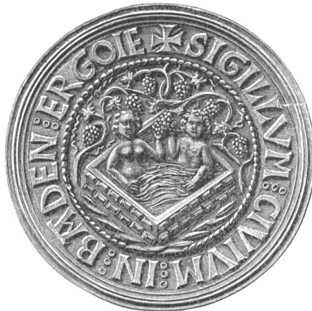
Fig. 133 Zweites Stadtsiegel von Baden nach dem Originalstempel.