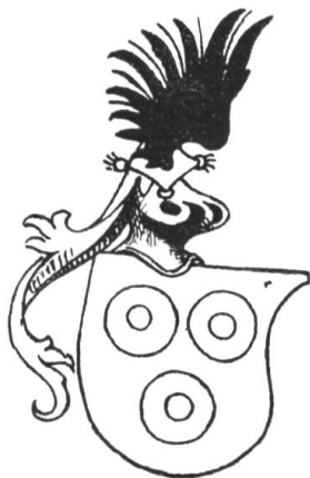
Fig. 60 v. Landenberg-Greifensee, 1469/73 (Anniversar Uster).

an den bekannten Autor des Wappenbuches Abt Ulrich Röschs von St. Gallen aus dem Jahre 1488 (Codex 1084 der Stiftsbibliothek St. Gallen). Es ist dies ein Papiermanuskript, in dem die musterhaft stilisierten Wappen mit kecker Feder gezeichnet und mit glatten Tönen koloriert sind. Der Maler, Hans Haggenberg, Bürger von St. Gallen, nennt sich mit der Jahreszahl am Ende eines Reimspruches. Derselbe hatte auch im Auftrage des Abtes vermutlich nach der 1483 stattgehabten Vollendung des Chores die westlich anstossende St. Michaelskirche mit Bildern ausgeschmückt. Bürgermeister Joachim v. Watt schreibt in seiner Chronik der Äbte (II, S. 376): „Einen maler bestalt er [der Abt] von Winterthur, hiess der Hakenberg; dem verdingt er das Münster ausserhalb des chors durch nider ze malen; namlich auf der linggen siten S. Gallen leben, in vil gefierte stuk abgeteilt, und zü der rechten siten S. Othmars mit infel und mantel, wie zü unsern zeiten die äbt gond“ 1 . . . . . „Under beilegenden liess er mancherlei waapen der fürsten, päpsten, grafen, freiherren und edlingen, darzü der burgern zü S. Gallen, besonders der alten geschlechten, gar zierlich machen, wie er zü Wil in einem sal ouch tün hat — dan Hakenberg seinen ouch ein lust hatt ze machen — auss einem waapenbüch, in welchem er vnzällig vill schilt des adels, besonders im Turgöw und Zürichgöw, züsamenbracht und mit zügehörigen farben aussgestrichen hat“.