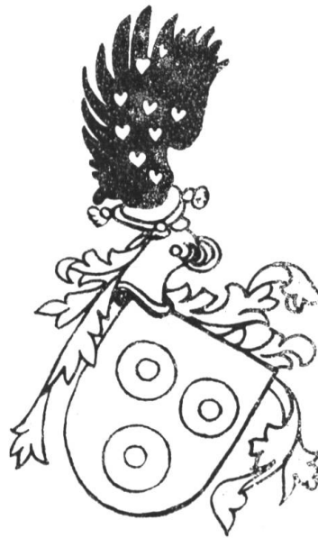
Fig. 61 v. Landenberg 1488 (Codex Haggenberg).

Eine genaue Stil- und Technikverglei- chung dürfte die Autoridentität sicher feststellen. Das im Archiv für Heraldik 1899, S. 14, aus dem Codex Haggenberg abgebildete Wappen v. Landenberg führen wir hier zum Vergleichen mit den Tafeln vor (Fig. 61). Das Doppelbürgerrecht in Winterthur und St. Gallen wird sich gerade aus dem obigen Ratsbeschluss von 1486 gegen einen her-