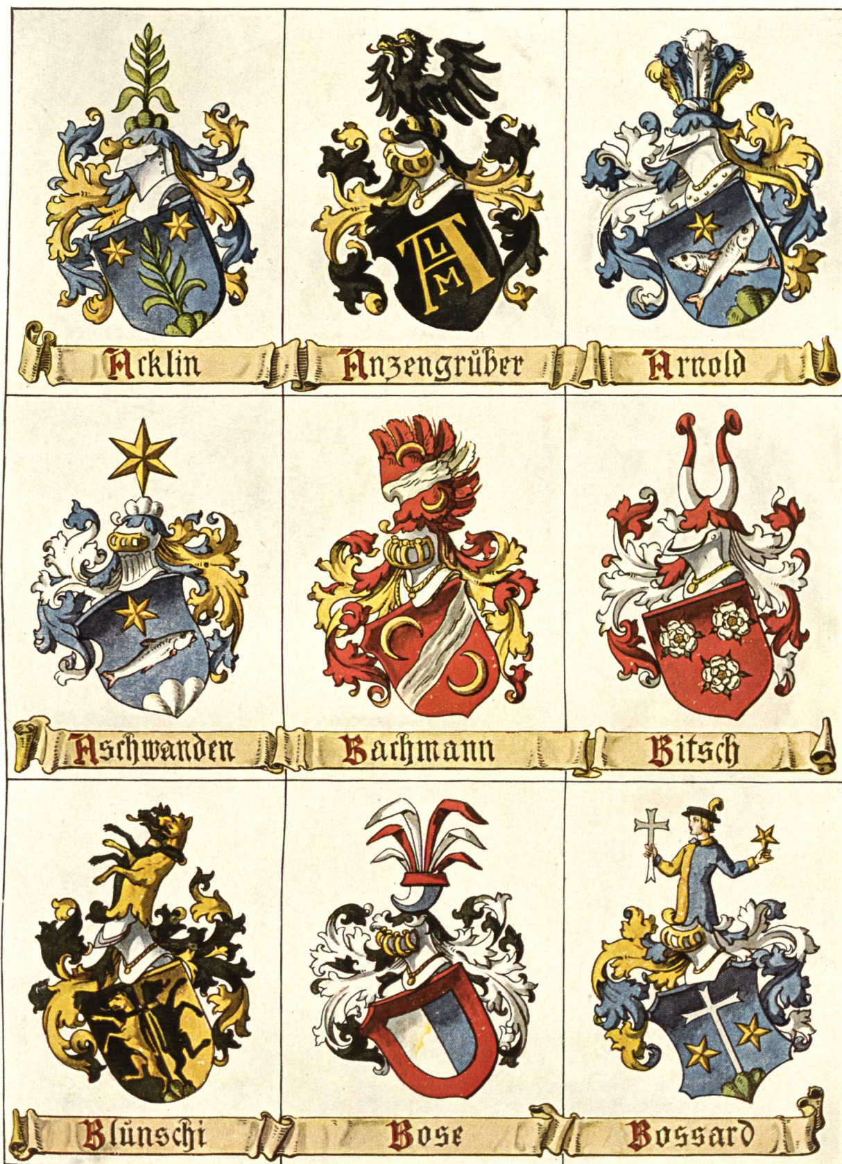
Probetafel aus dem Zuger Wappenbuch 1910